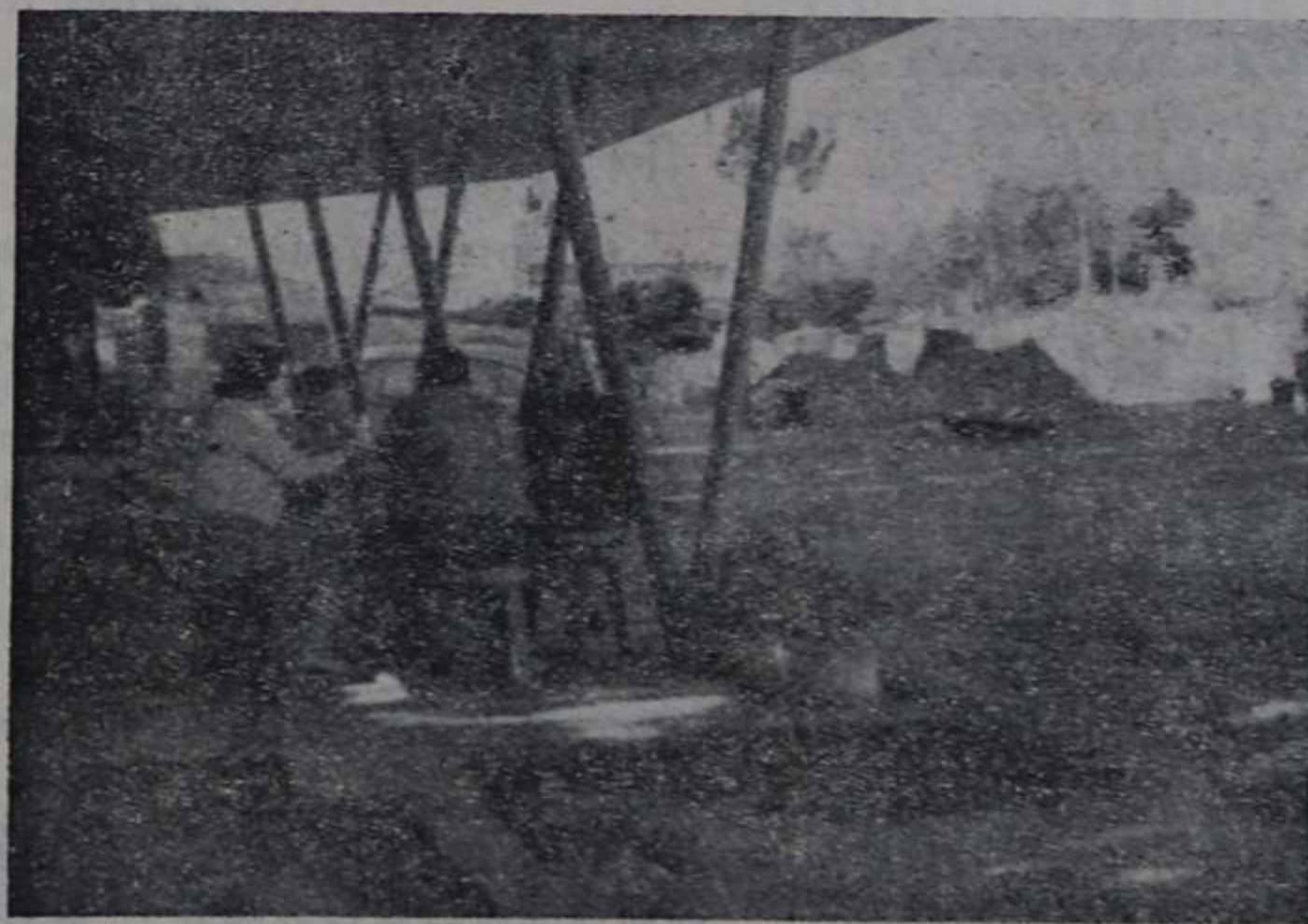
Um pormenor do actual Parque de Campismo

para onde deve ser dirigida toda a correspondência referente ao nosso jornal.