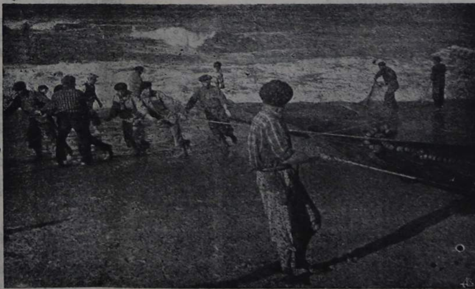
O SAIR DA REDE

Que todos os que possam, os auxiliem, na continuação do mais velho e característico costume da pesca do arrasto, grande cartaz do turismo de Espinho.