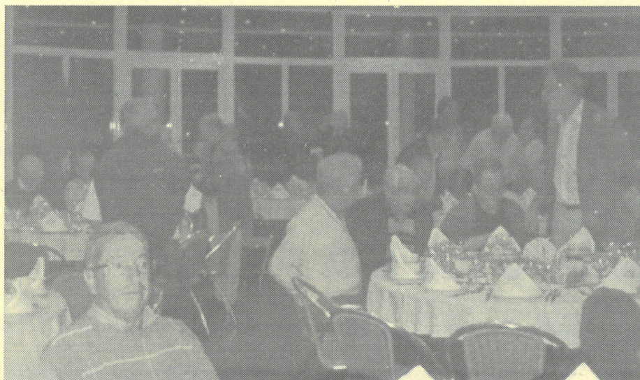
Jantar de 2005

enviadas até ao dia 23 de Setembro , para a Rua 20 n.º 1370-1.º Esq.º 4500-263 Espinho, ou feitas na Casa Romeu, Rua 19 n.º 242, ou ainda pelos telefones 966052010 (Meneses) e 918527893 (Faustino).