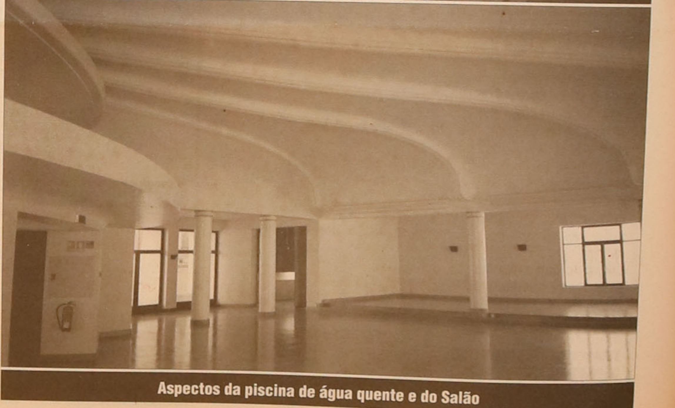
Aspectos da piscina de água quente e do Salão