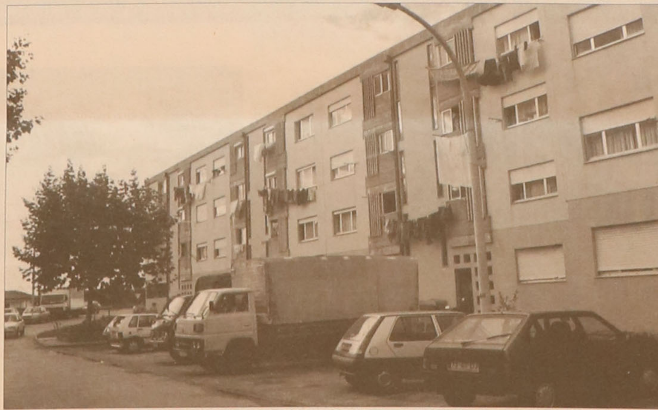
O Bairro da ponte de Anta ocupou grande parte da reunião