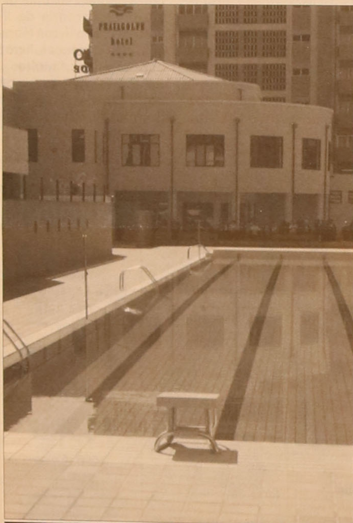
A eventualidade de provas desportivas foi prevista

A julgar pelos comentários que se iam ouvindo, a opinião dos espinhenses acerca da nova Piscina é bastante favorável. Desiludido terá ficado um cidadão que compareceu à cerimónia devidamente equipado de calções de banho e toalha, quando foi informado que não poderia efectuar um mergulho inaugural, a que o calor convidava. ■ J.B.