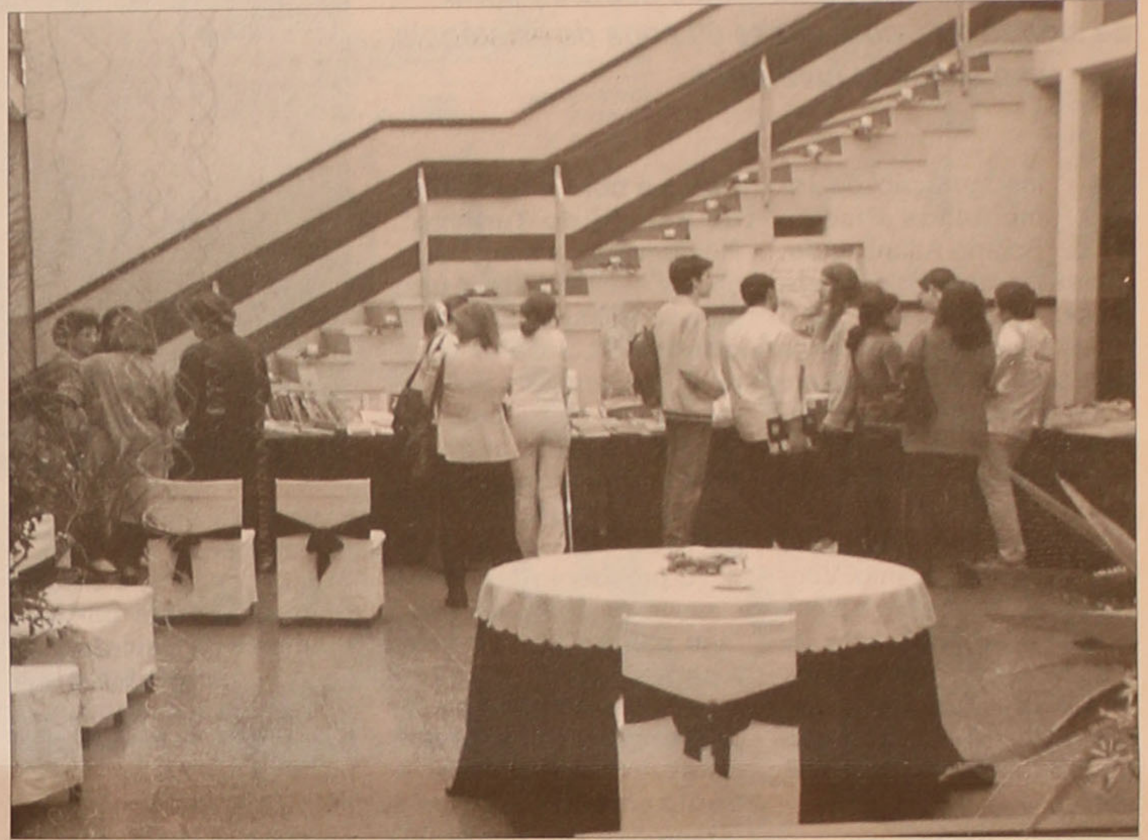
A feira do livro da 'Gomes de Almeida' pretende incentivar os mais jovens à leitura