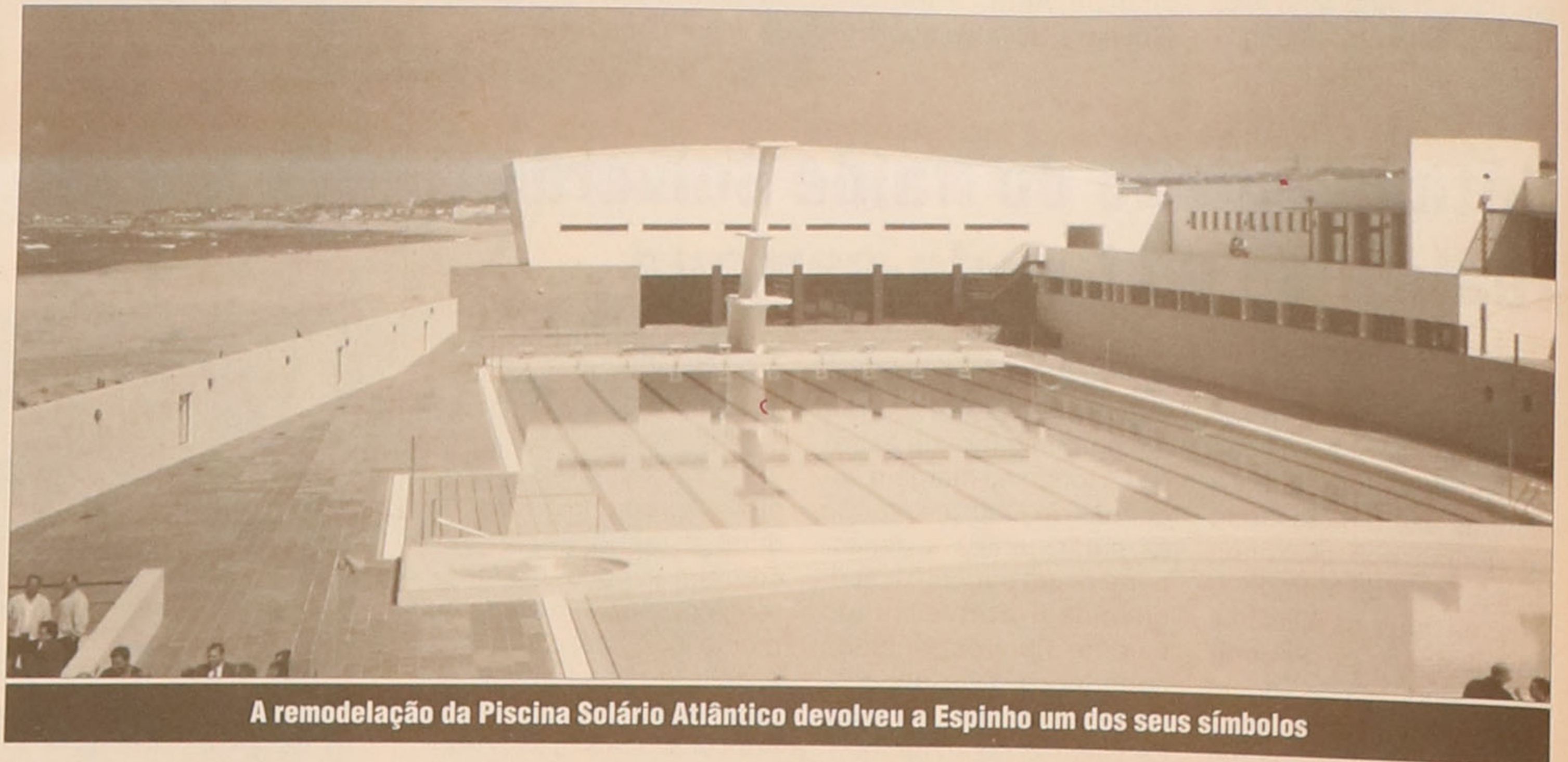
A remodelação da Piscina Solário Atlântico devolveu a Espinho um dos seus símbolos

Afirmando que aquela cerimónia não era “mais uma inauguração, tem um significado importante”,