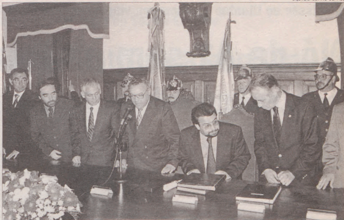
O protocolo para o enterramento da linha foi assinado entre a CME e a REFER a 8 de Maio de 1999

Como tal, a REFER considerava necessário um conhecimento mais detalhado sobre a posição do firme rochoso nesta zona para avaliar melhor a situação e para ser prevista a obra de protecção a construir. O receio desta entidade prendia-se com o facto de o secretário de Estado do Ambiente ter posto como condição que a REFER assumisse a inteira responsabilidade pela obra em causa e riscos associados. A somar a tudo isto, a RE-