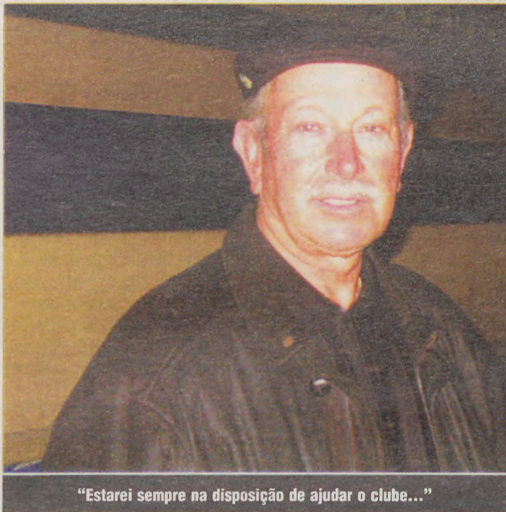
“Estarei sempre na disposição de ajudar o clube...”

Mas a Académica é como qualquer clube, tem os seus altos e baixos. Temos os pés bem assentes no chão, e vamos até onde nos for possível chegar. Não esqueçamos que este é um clube