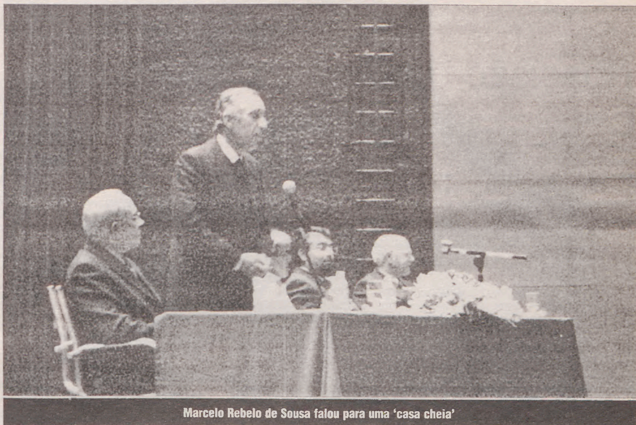
Marcelo Rebelo de Sousa falou para uma 'casa cheia'

balização prende-se, disse, com o facto de ela ser boa ou má. Mas, para Marcelo Rebelo de Sousa, há que pensar que tipo de globalização queremos, porque ela não é neutral e está ao serviço de valores. Valores esses que podem ser personalistas, isto é, que respeitam os direitos do Homem, ou podem ser anti-personalistas, ou seja, que sacrificam as pessoas em diversas questões.