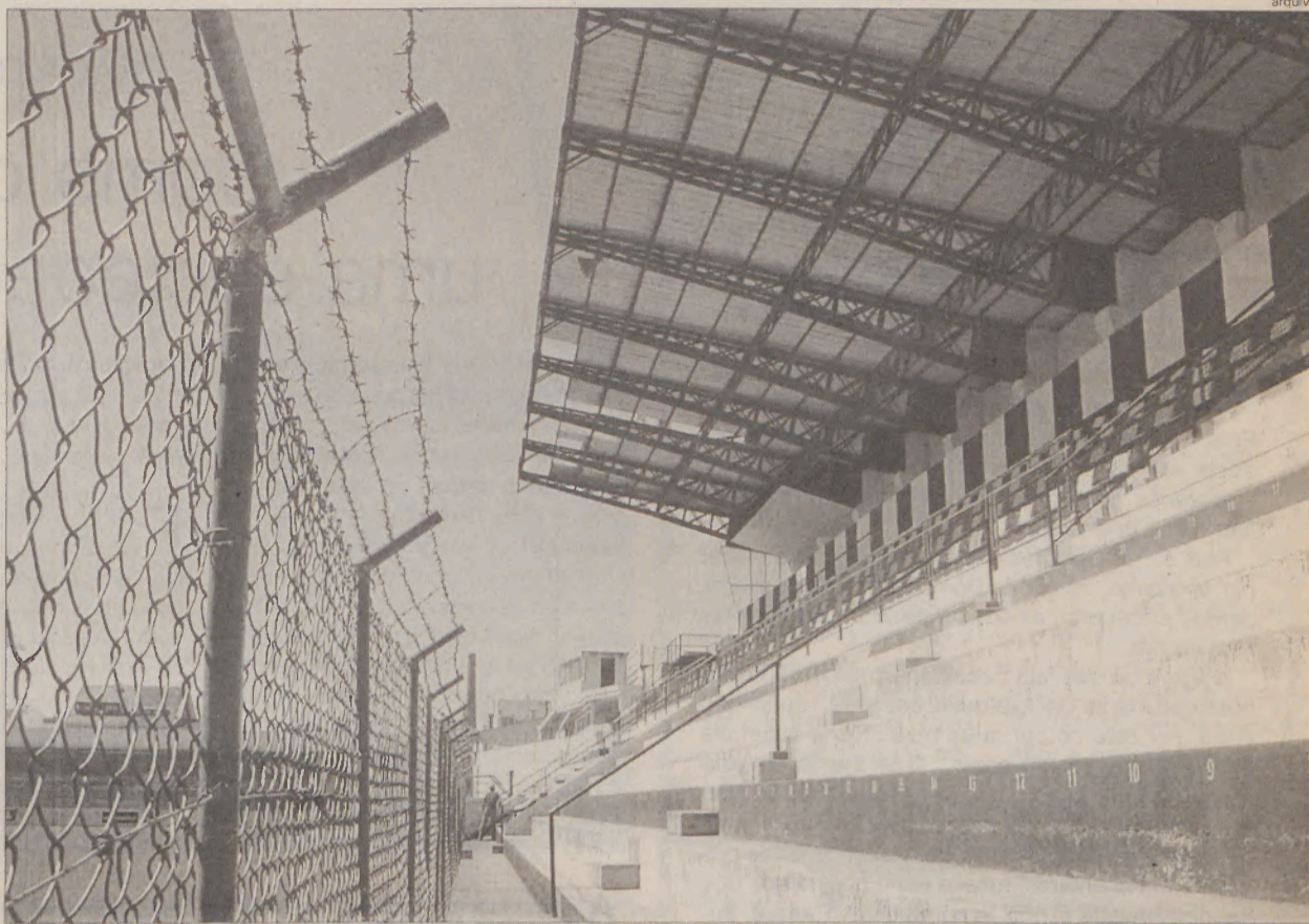
Solução passará pela venda dos terrenos do Estádio Comendador Manuel Violas