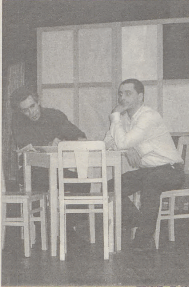
Uma cena da peça Feliz Aniversário

MV: O início dos ensaios desta peça tornou-se complicado?