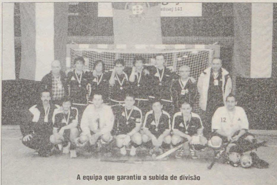
A equipa que garantiu a subida de divisão

Os jogadores da Académica chegaram a Espinho visivelmente cansados mas também muito animados. Alguns elementos da comitiva chegaram a Espinho