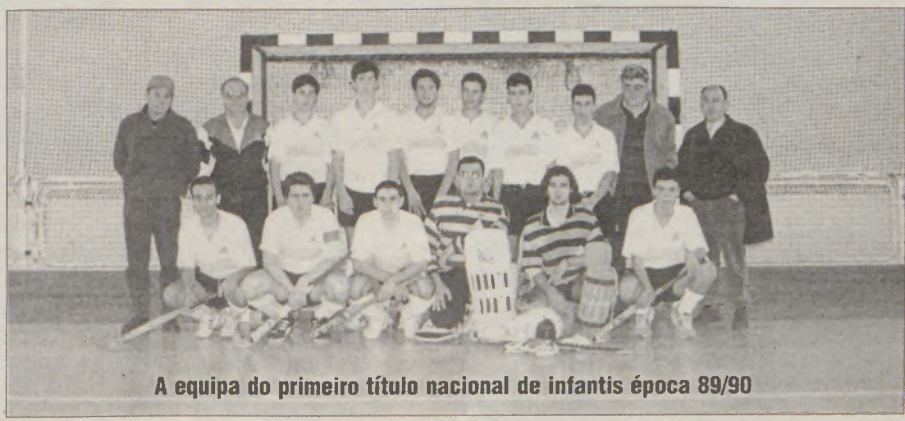
A equipa do primeiro título nacional de infantis época 89/90

2 títulos da 2ª Divisão; 1 título de Juniores; 2 Taças de Portugal; 1 Taça das Taças Divisão C. ■ D.A.S.