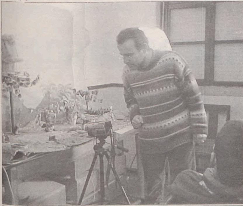
Filme realizado por jovens portadores de deficiência será exibido a 29 de Março