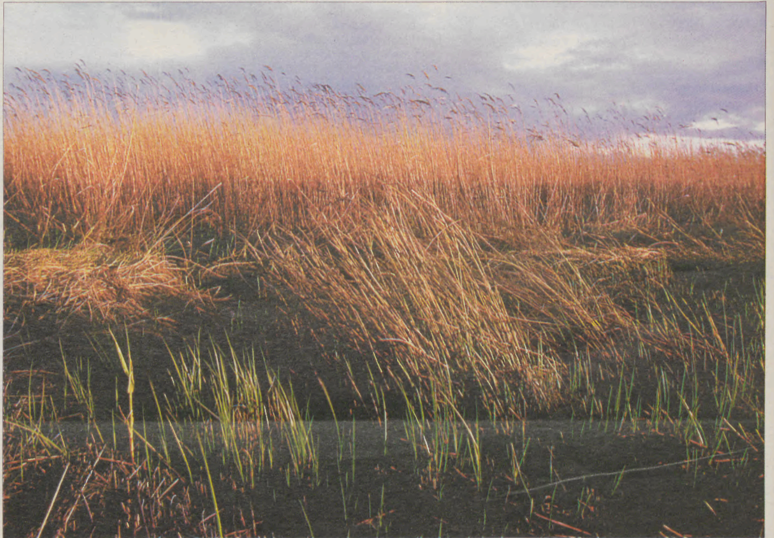
Situação geográfica da Barrinha de Esmoriz/Lagoa de Paramos tem sido um entrave à solução do problema

As principais ameaças que pairam hoje sobre a Barrinha de Esmoriz/Lagoa de Paramos são, por ordem de importância, a poluição a montante das ribeiras de Rio Maior e de Maceda, a falta de ordenamento de território e, final-