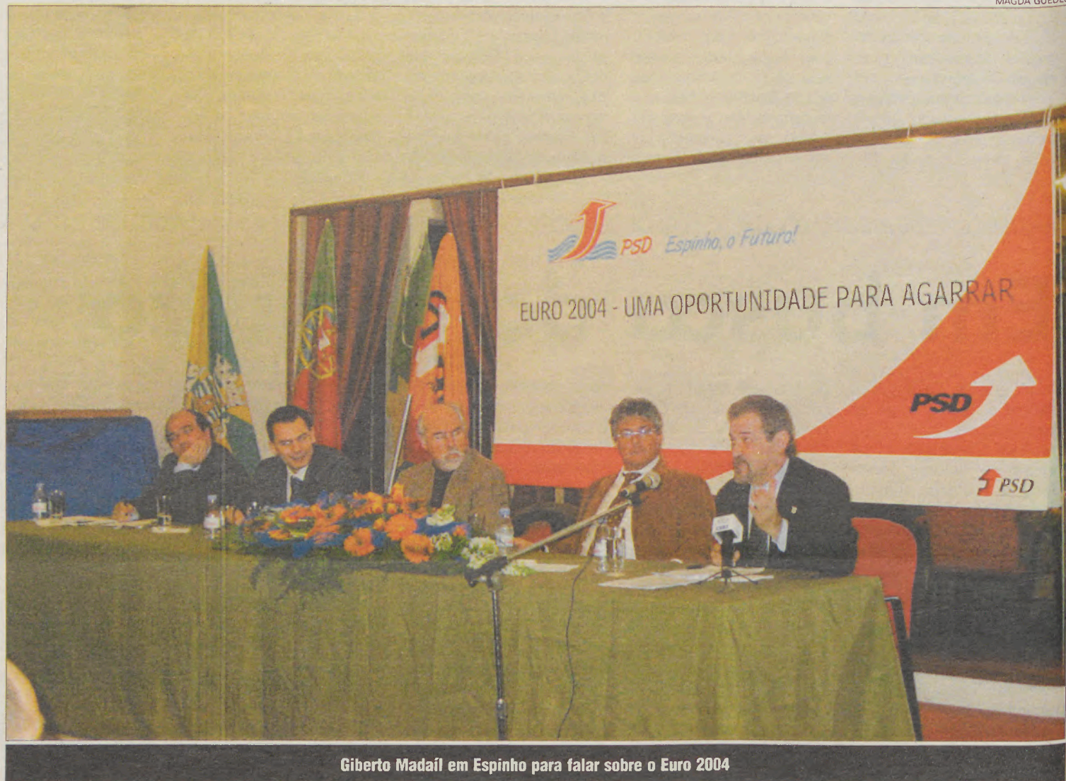
Gilberto Madaíl em Espinho para falar sobre o Euro 2004

Mesmo estando favorecida por este facto, Espinho tem que aproveitar e agarrar esta oportunidade que lhe é oferecida e organizar as mais variadas formas de captar a atenção dos adeptos. Através das praias locais, melho-