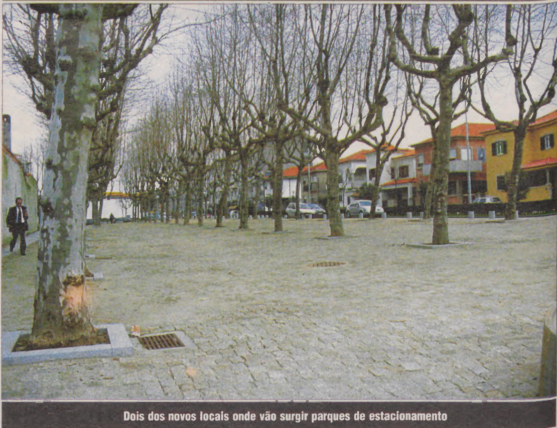
Dois dos novos locais onde vão surgir parques de estacionamento

que durante aquela época precisa de oferecer estacionamento para as pessoas deixarem as suas viaturas. Há que recordar igualmente que o passeio da beira-mar, cujas obras já estão em fase adiantada, vai tirar algum estacionamento, principalmente o estacionamento ilegal.