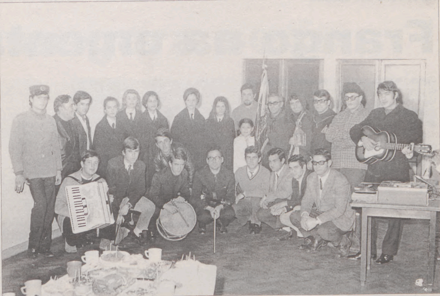
1.º grupo de janeiras da Associação Académica de Espinho com o objectivo de angariação de fundos para a construção do pavilhão (1965)