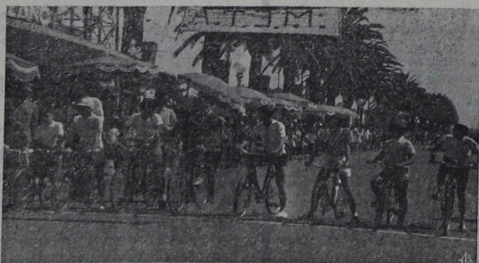
1 GRANDE CIRCUITO CICLISTA INFANTIL Provas do rapazes dos 12 aos 13 anos Os concorrentes aguardando o sinal da partida