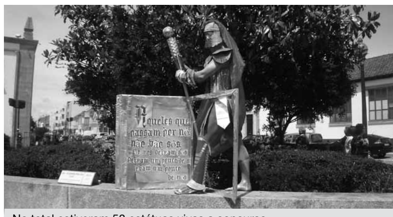
No total estiveram 53 estátuas vivas a concurso