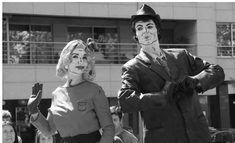
Casal que deu vida à estátua Kiss recebeu o Prémio do Júri