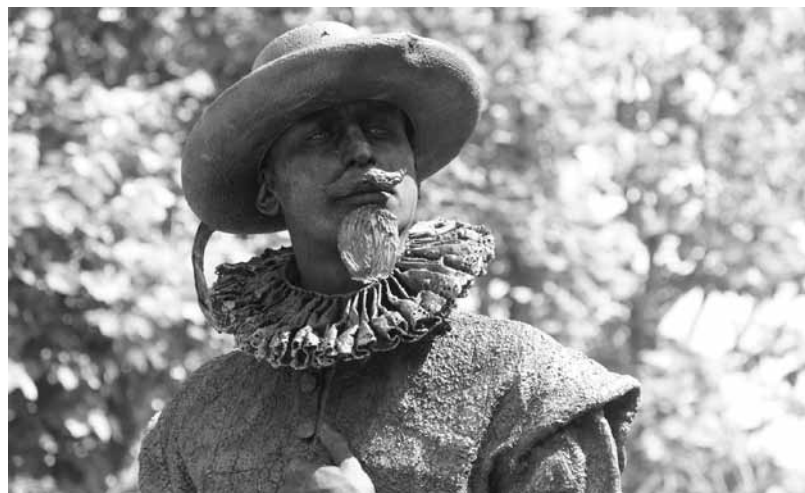
Van der Werf também recebeu o Prémio do Júri