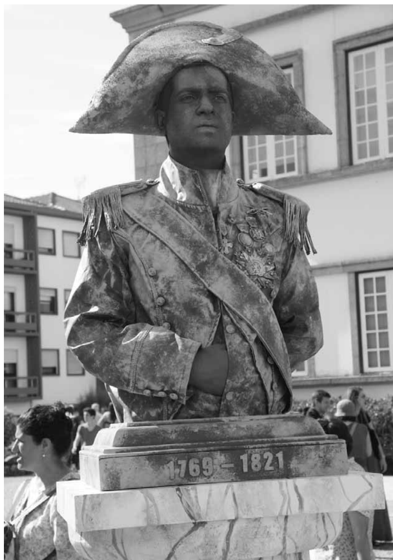
Napoleão Bonaparte recebeu o Prémio do Júri