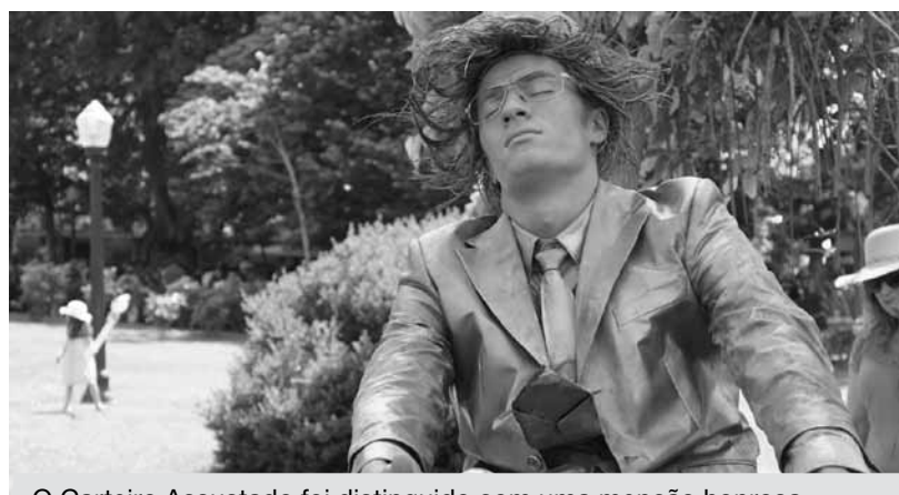
O Carteiro Assustado foi distinguido com uma menção honrosa