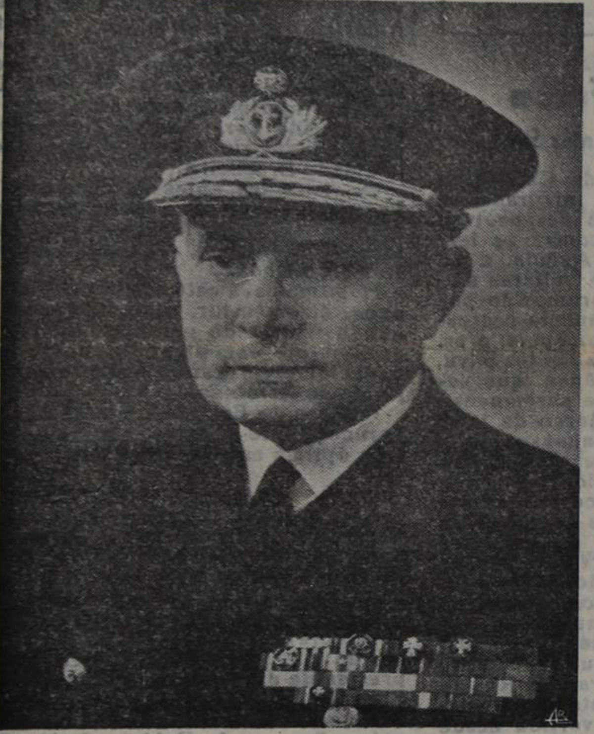
O Senhor Contra-Almirante Américo Deus Rodrigues Tomaz, reeleito presidente da República Portuguesa, para um novo septenato

Ao receber o presidente da Assembleia Nacional e os restantes membros da mesa eleitoral, o sr. Contra-Almirante Américo Tomás declarou: