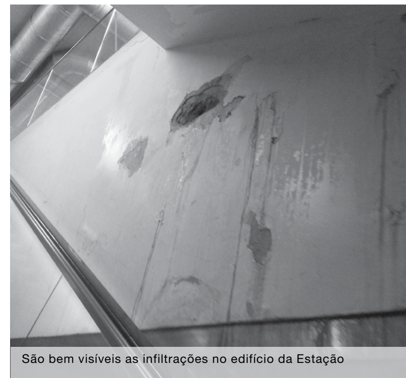
São bem visíveis as infiltrações no edifício da Estação

A petição (que nada tem a ver com a iniciativa do grupo de cidadãos acima mencionado) que está no endereço http://peticaopublica.com/PeticaoVer.aspx?pi=P2013N34628 tem já 113 signatários. Alguns dos cidadãos que assinaram deixaram comentários sobre a degradação da infraestrutura, queixando-se de como uma obra tão recente tem já tantos problemas. Houve quem se queixasse das infiltrações, dos acessos e portas de entrada fechados, exigindo a resolução destes problemas.