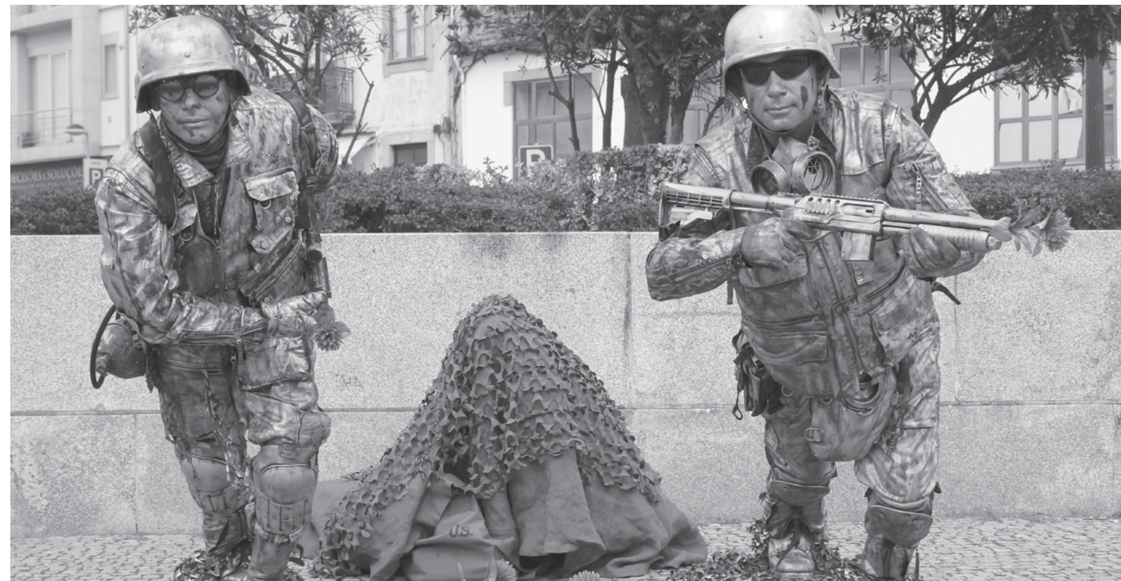
Foram atribuídas menções honrosas a: Memória dos soldados, Desrendilhando o Tempo e Xadrez , jogas ?