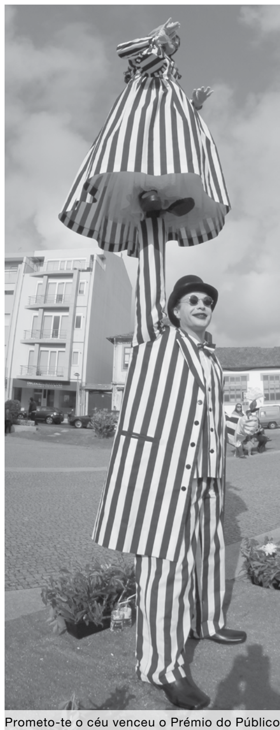
Prometo-te o céu venceu o Prémio do Público