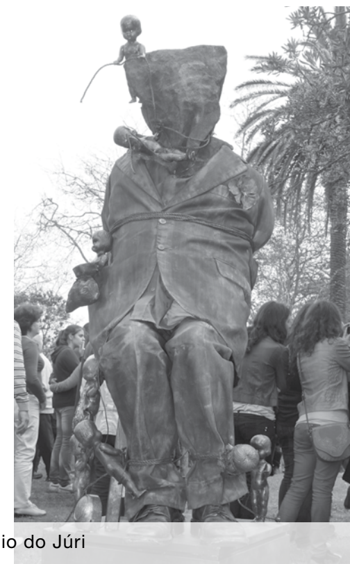
Afonso Henriques, Flora e Capturado venceram o prémio do Júri