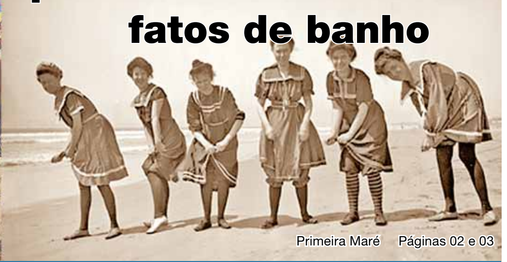
Primeira Maré Páginas 02 e 03

Diretor: Nuno Oliveira | Ano XXXVII N.º 1780 EUR 0.50 | Sai à quarta-feira 03/07/2013