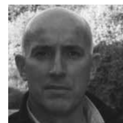
Opinião Nunes da Silva

Quem tivesse estado este fim-de-semana em Espinho, residente ou que use a cidade, terá ficado surpreendido pela agitação e animação que se verificava, e quem estivesse menos informado ter-se-á questionado "o que é que se passa em Espinho?", e ao tentar obter resposta terá ficado tentado em permanecer o dia todo na cidade, pois apercebeu-se que música, exposições, cinema, expressão teatral e animação de rua se tinham