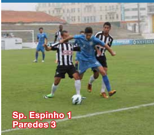
Sp. Espinho 1 Paredes 3

Sp. Espinho desilude na apresentação aos sócios