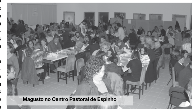
Magusto no Centro Pastoral de Espinho

Ainda no sábado, o Aeroclube da Costa Verde vai realizar um magusto nas suas instalações. A iniciativa está marcada para as 15h00. LM