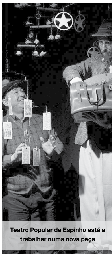
Teatro Popular de Espinho está a trabalhar numa nova peça

Nada que seja estranho ao orçamento igualmente aprovado, o qual apresenta uma linha de forte continuidade com o de 2013, mantendo praticamente inalterados os valores para as receitas e as despesas, o que, se transmite alguma garantia de segurança de execução, não é todavia a situação mais favorável para poder sustentar o previsto crescimento das atividades. Tal fica a dever-se ao recuo dos apoios oficiais, mas aqui a boa notícia é que a Nascente tem vindo a conseguir angariar mais receitas próprias, através da diversificação das atividades, reforçando assim a autonomia possível perante os sempre indispensáveis subsídios. A este respeito, uma proposta de atualização dos valores das quotas e da assinatura