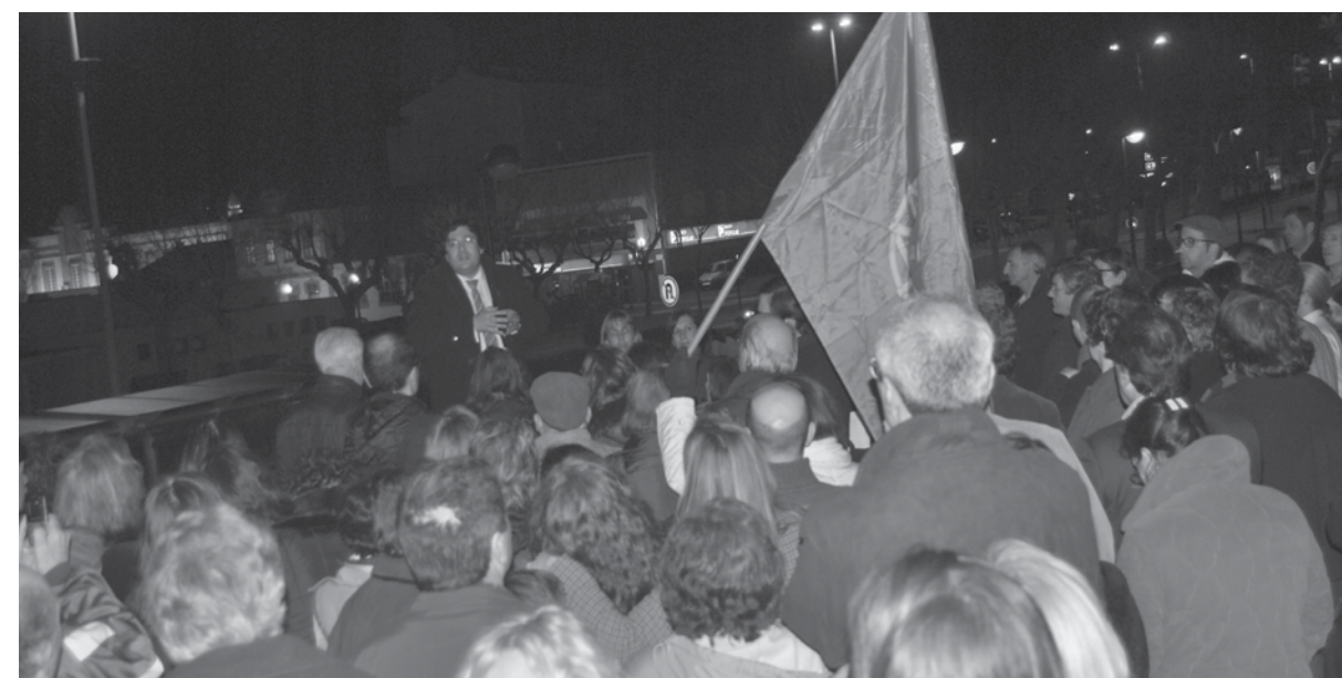
Mais de 200 pessoas manifestaram a sua indignação pela perda das valências do Tribunal de Espinho

M ais de 200 pessoas reuniram-se, na terça-feira à noite (18 março), numa vigília em defesa da manutenção das valências do Tribunal de Espinho. Advogados, promotores da iniciativa e população que se juntou em frente ao palácio da Justiça, recusam a saída de juízos para Feira e Oliveira de Azeméis de acordo com as Linhas Estratégicas para a Reforma da Organização Judiciária.