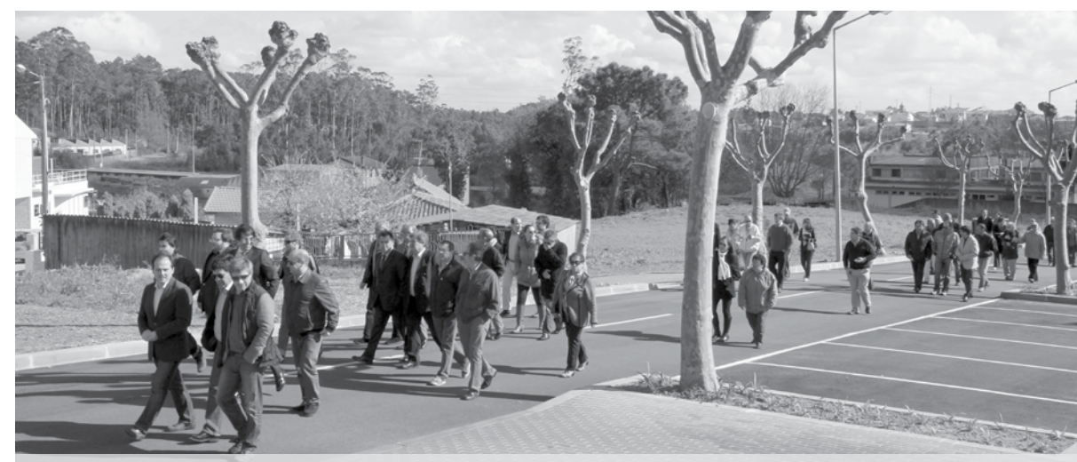
A rua principal no Bairro da Ponte de Anta foi alvo de uma requalificação. A obra foi inaugurada no sábado à tarde.

No passado sábado, o presidente da Câmara Municipal de Espinho, Pinto Moreira, inaugurou mais uma obra no Bairro da Ponte de Anta: a requalificação da principal rua do aglomerado populacional. O autarca disse que o investimento nos espaços exteriores do bairro melhora a qualidade de vida dos moradores e acrescentou que esperava que o governo fizesse obras nos prédios.