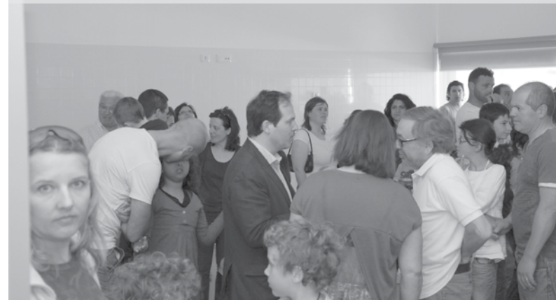
Dezenas de encarregados de educação e alunos visitaram o novo centro escolar de Paramos

As crianças experimentaram alguns equipamentos de recreio, conheceram as novas salas de aula e mostraram grande entusiasmo pela nova escola que os vai receber. Nuno Oliveira