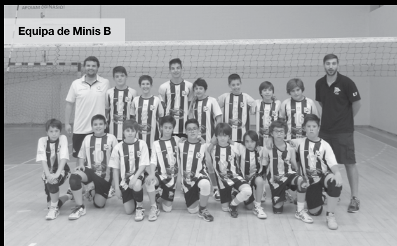
Equipa de Minis B

A equipa vareira entrou a meio gás e contra a campeã regional e primeira classificada do grupo nunca é o suficiente. Aliando-se ainda às condições difíceis para a prática de voleibol, um pavilhão de tecto baixo e um calor insuportável, as espinhenses apenas começaram a responder no terceiro parcial onde estiveram sempre na frente e só na recta final permitiram aproximação e consequente vitória à equipa