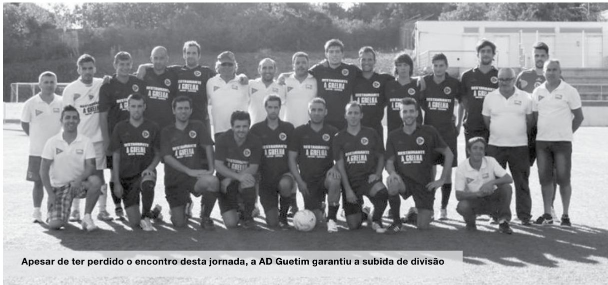
Apesar de ter perdido o encontro desta jornada, a AD Guetim garantiu a subida de divisão

No jogo quente do fim de semana, a turma de Esmoães renasceu das cinzas e venceu o derby frente aos Águias, conseguindo não só evitar já a descida