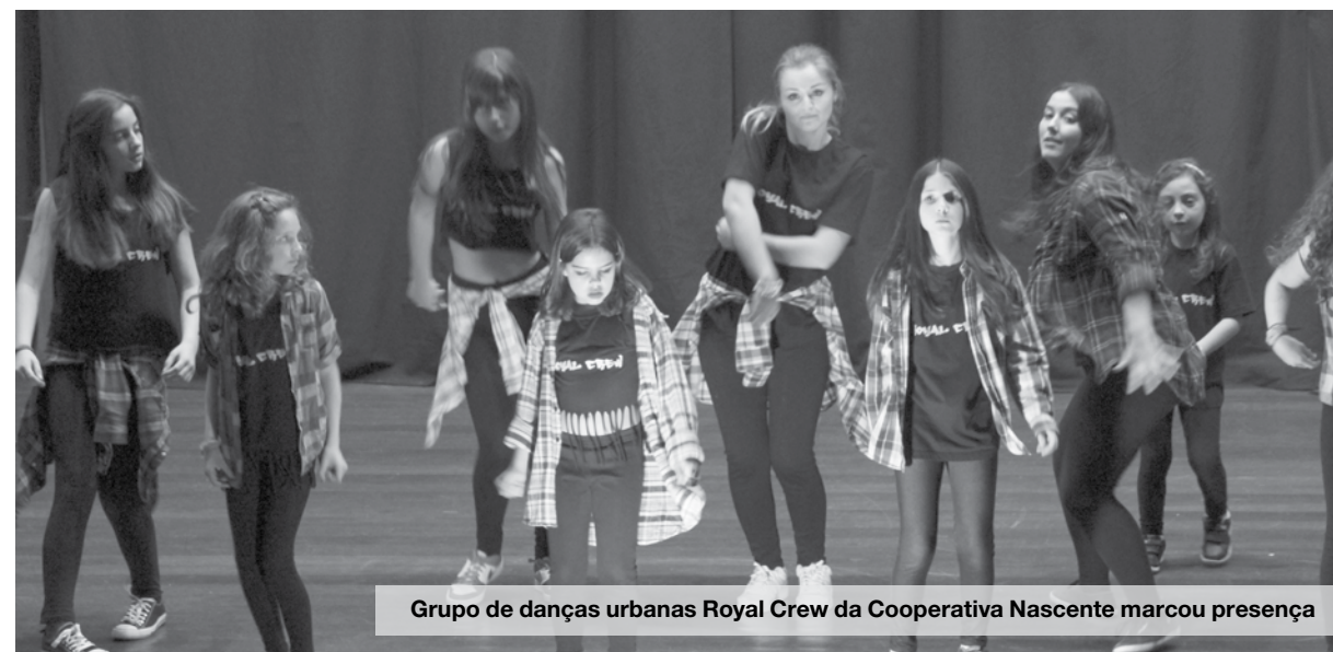
Grupo de danças urbanas Royal Crew da Cooperativa Nascente marcou presença

Talento foi coisa que não faltou na noite de sábado no Auditório da Junta de Freguesia de Espinho. A sala, com uma lotação quase esgotada, foi palco de um espetáculo com jovens talentos espinhenses. A aposta em artistas – uns mais conhecidos, outros nem tanto – do concelho num só espetáculo foi ideia da Associação Espinho Vida. O grupo quis, além de proporcionar uma noite