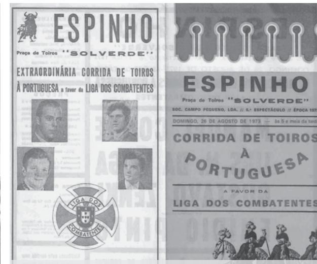
Cartaz de uma corrida que teve lugar na Praça de Touros