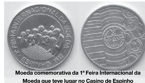
Moeda comemorativa da 1ª Feira Internacional da Moeda que teve lugar no Casino de Espinho

O povo saiu à rua. Não houve um programa de festas mas houve desfile das fanfarras das duas corporações de bombeiros locais. E houve festa pois, afinal de contas, a cidade de Espinho tinha acabado de nascer. Nuno Oliveira