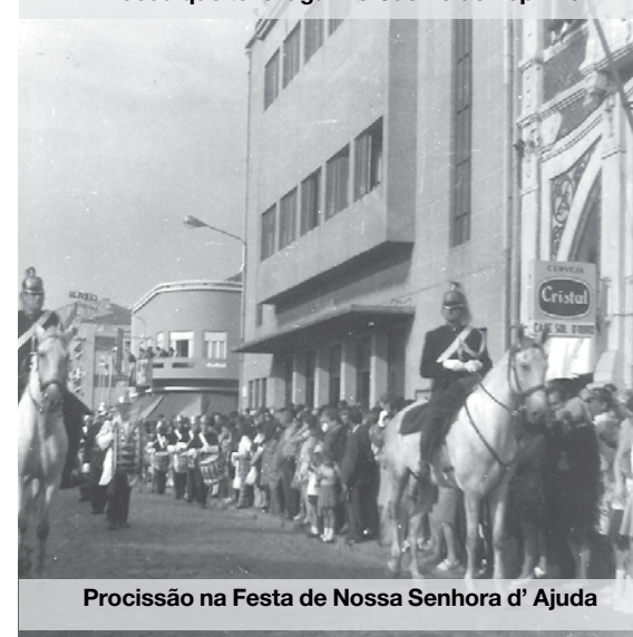
Procissão na Festa de Nossa Senhora d' Ajuda