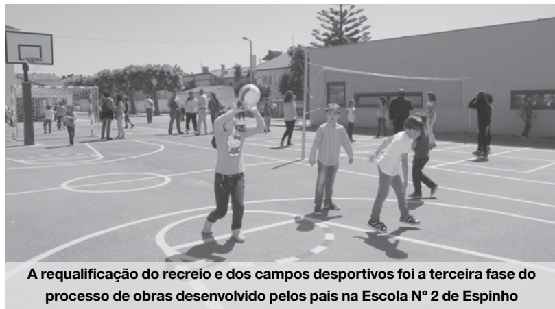
A requalificação do recreio e dos campos desportivos foi a terceira fase do processo de obras desenvolvido pelos pais na Escola Nº 2 de Espinho

associação na altura em que tudo começou, disse ser “um orgulho e