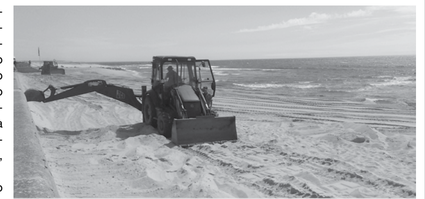
Praias de Espinho estarão prontas para o arranque da época balnear

Segundo o vice-presidente da autarquia, estes dias que faltam até à abertura de mais uma época balnear serão para terminar esses trabalhos e começar a montar as instalações para que "tudo esteja pronto".