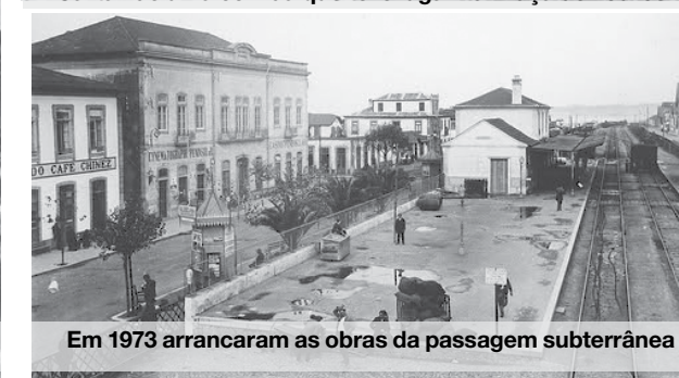
Em 1973 arrancaram as obras da passagem subterrânea