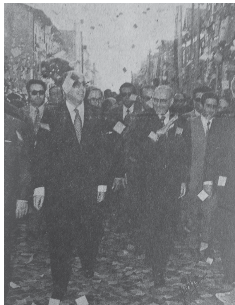
Espinho recebeu Marcelo Caetano num clima de festa.

Estávamos em tempos de ditadura mas ainda assim Espinho dava sinais de querer crescer. Assim, em janeiro de 1973, o Casino de Espinho acolhe a I Feira da moeda. Um evento de sucesso que teve direito a uma moeda especial evocativa. Ainda nesse mês, o mar voltou a fazer das suas e um temporal destrói novamente o muro da piscina e quase toda a esplanada do lado norte. Apesar de só ter avançado em março (dia 24), é em fevereiro que são anunciadas oficialmente as obras da passagem subterrânea do caminho-de-ferro. No mês mais curto do ano, "Lito" Gomes de Almeida reabre a "Casa da Saúde" que o seu pai (Dr. Manuel Gomes de Almeida) tinha aberto 40 anos antes mas devido à sua morte em 1972 tinha sido encerrada. São anunciados também os projetos de ampliação para o Hospital de Espinho. Em abril, falece Benjamim Dias, fundador do jornal Defesa de Espinho. Amadeu Morais assume então as funções de diretor. Ainda em abril é anunciada a criação de Comarca de Espinho mas é em maio que o projeto finalmente se concretiza. Manuel de Oliveira Violas funda a 12 de abril a Solverde - Sociedade de Investimentos Turísticos da Costa Verde S.A, liderando um grupo de investidores da região de Espinho. Vocacionada para a área turística, a Solverde surge com o intuito de conjugar lazer, animação, cultura, investimento e emprego. Em 1973 ganha a