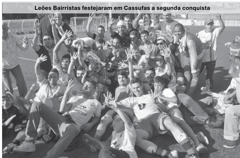
Leões Bairristas festejaram em Cassufas a segunda conquista