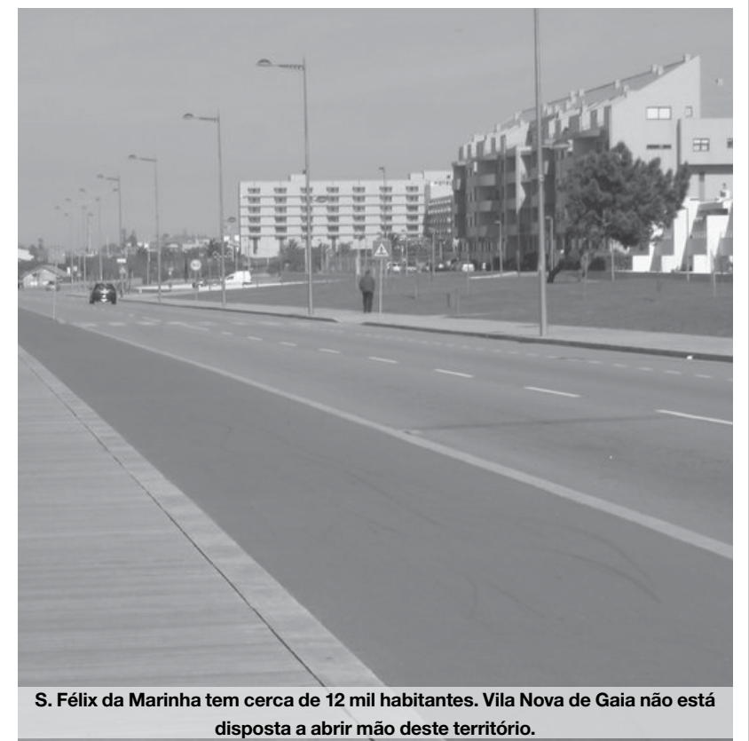
S. Félix da Marinha tem cerca de 12 mil habitantes. Vila Nova de Gaia não está disposta a abrir mão deste território.