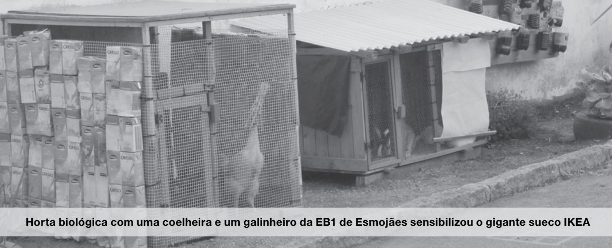
Horta biológica com uma coelheira e um galinheiro da EB1 de Esmojães sensibilizou o gigante sueco IKEA

U ma horta biológica, onde não faltam uma coelheira e um galinheiro totalmente feitos com materiais usados, deu à EB1 de Esmojães um prémio atribuído pelo IKEA. A empresa sueca lançou o desafio “O que mudavas na tua escola para gostares mais dela?” e, na escola antense, alunos, professores e pais puseram mãos à obra para concretizá-lo.