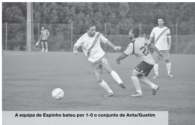
A equipa de Espinho bateu por 1-0 o conjunto de Anta/Guetim

II Prova BTT Resistência 2h30 Vila de Silvalde realizou-se este domingo de manhã