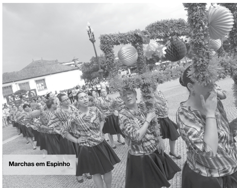
Marchas em Espinho