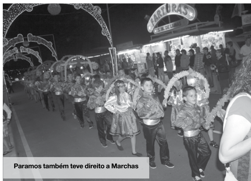
Paramos também teve direito a Marchas

passado sábado à noite e contou com a participação de muitos habitantes daquela zona da freguesia, incluindo muitas