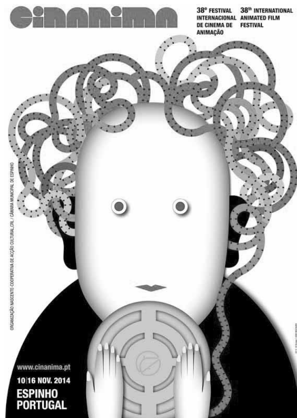
www.cinanima.pt 10/16 NOV. 2014 ESPINHO PORTUGAL

A pré-seleção arranca no próximo dia 21 de Julho e estender-se-á pelos fins de semana seguintes, nos quais o Júri de Seleção do CINANIMA 2014 que terá a árdua tarefa de deliberar quais os filmes que irão passar à fase competitiva, em novembro. MV