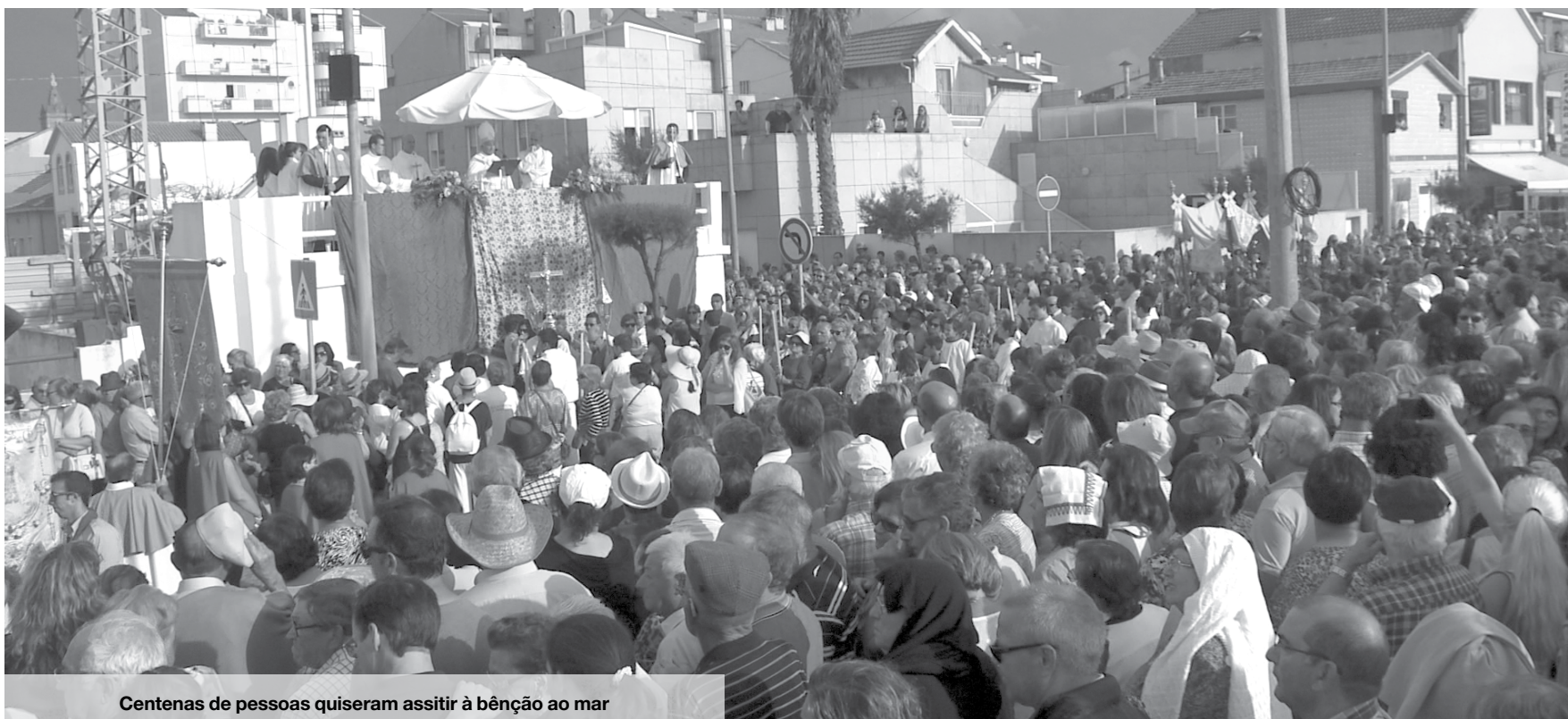
Centenas de pessoas quiseram assistir à bênção ao mar

Terminada a bênção, os andores continuaram o percurso pelas ruas 23, 18, 19 e 8 até chegar novamente à capela. Com a procissão no final, a chuva voltou a cair, obrigando quem ainda permanecia no centro da cidade a abrigar-se ou a correr para os carros. LM