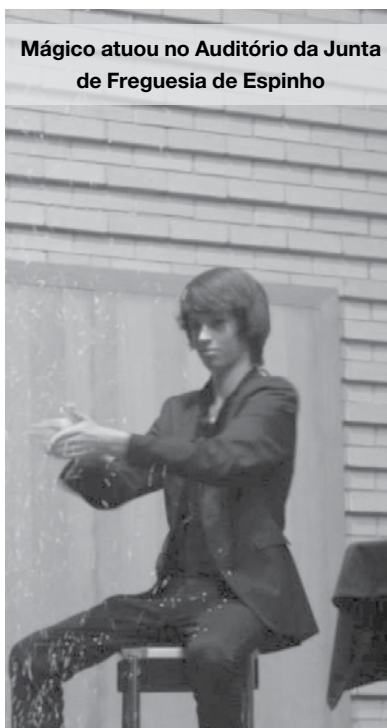
Mágico atuou no Auditório da Junta de Freguesia de Espinho

O jovem mágico foi muito aplaudido e elogiado pelas pessoas presentes na plateia, que lhe gabaram o talento e a capacidade de entreter em cima do palco. Já João Soares agradeceu a presença de todos assim como o apoio e o respeito pelo seu trabalho. Nuno Oliveira