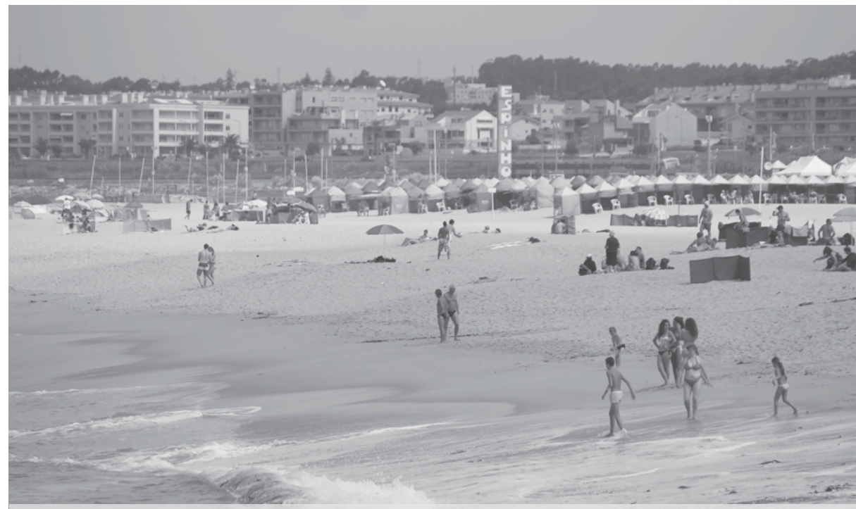
Praia de Espinho foi a 18ª mais "visitada" pelos utilizadores do Facebook durante este verão

A página oficial do Facebook em Portugal divulgou o top das 30 praias de Portugal que registaram mais check-ins naquela rede social. Sem grandes surpresas, o Algarve lidera com três praias nos quatro primeiros lugares. Espinho surge em 18º lugar à frente de praias como Porto Santo, Zambujeira ou Sines.