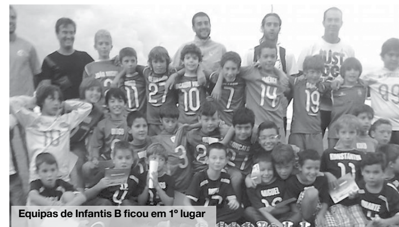
Equipas de Infantis B ficou em 1º lugar

A equipa de Traquinas B do Anta participou no Torneio Esmoriz em Movimento e arrecadou um brilhante 1º lugar. Depois de passar a fase de grupos em 1º e sem derrotas, os antenses venceram a meia final contra a equipa do Tarei, por números muito expressivos. Já na grande final os baixinhos voltavam a encontrar o Fiães e assistimos a mais um encontro equilibrado entre duas boas equipas. Depois de marcar um golo cedo no jogo, os antenses deixaram – se adormecer e sofreram dois golos já no decorrer