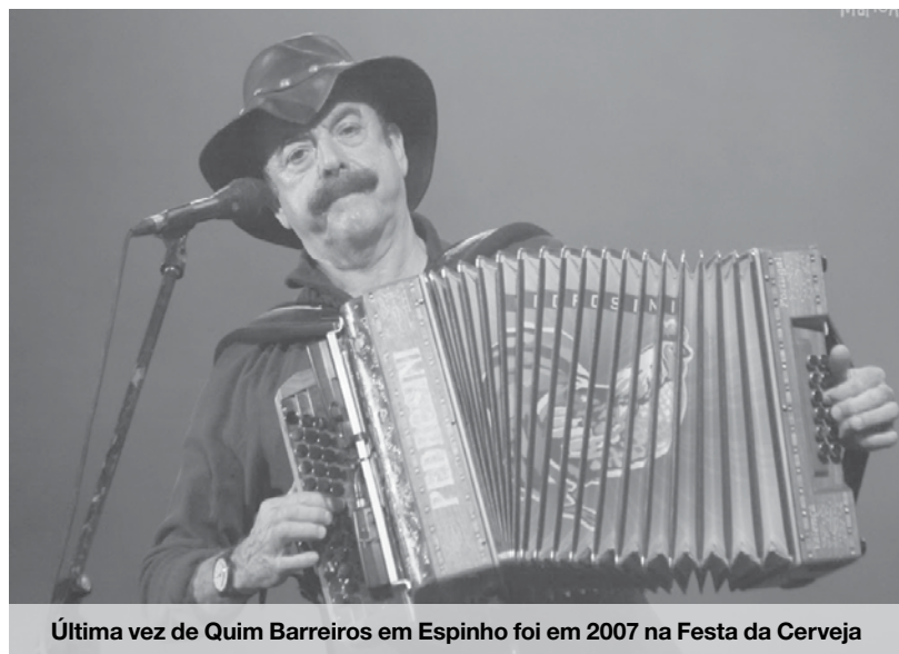
Última vez de Quim Barreiros em Espinho foi em 2007 na Festa da Cerveja

decorre, também em Esmojães, a tradicional festa dos tremoços. No sábado, às 21h00, o grupo de bombos "Zés Pereiras" vai entrar no arraial com a Comissão de Festas, seguindo-se uma noite de folclore português com a presença do Grupo Etnográfico de Esmoriz, Rancho Folclórico de S. Paio de Oleiros, Grupo Folclórico Os Fogueteiros de Arada e Gru-