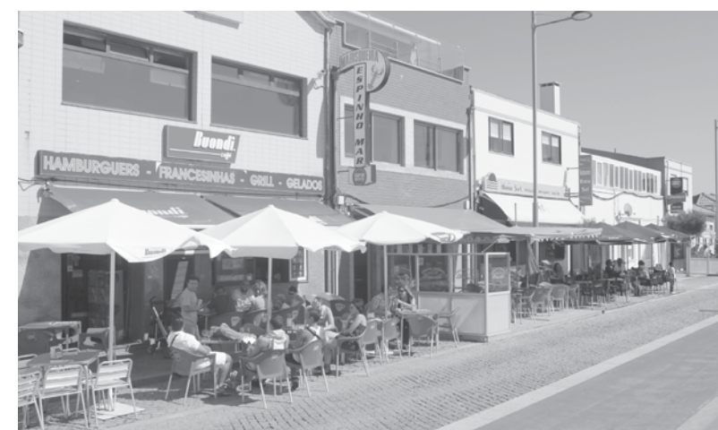
Verão 2014 não foi o mais simpático para os comerciantes à beira mar