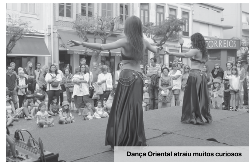
Dança Oriental atraiu muitos curiosos

A Câmara Municipal de Espinho, numa estreita colaboração com as coletividades da terra, lançou o desafio à Cooperativa Nascente para organizar este dia. A Nascente não virou as cos-