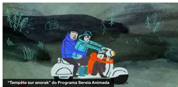
"Tempête sur anorak" do Programa Sereia Animada