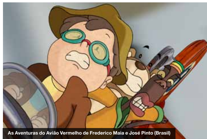
As Aventuras do Avião Vermelho de Frederico Maia e José Pinto (Brasil)

15 nov. 15H30 | Luz, Anima, Ação | Eduardo Calvet | Brasil | 2012 | documentário | +12 17H30 | As aventuras do avião vermelho | Frederico Pinto, José Maia | Brasil | longa-metragem | +6