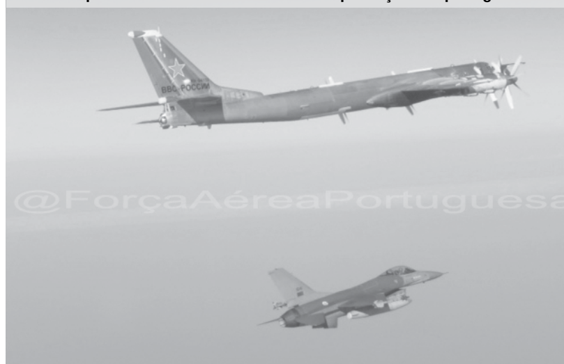
A Força Aérea Portuguesa divulgou no seu site imagens dos aviões russos interceptados e escoltados esta sexta-feira por caças F-16 portugueses.

Este tipo de interceções no espaço aéreo internacional são "procedimentos normais", mas, segundo um comunicado da NATO, "a dimensão destes voos russos representa um nível incomum de atividade aérea sobre o espaço aéreo europeu". Desde o início do ano, a NATO já interceptou aviões russos em cem ocasiões, o triplo do registado em 2013. O alerta da NATO vem no quadro de uma degradação cada