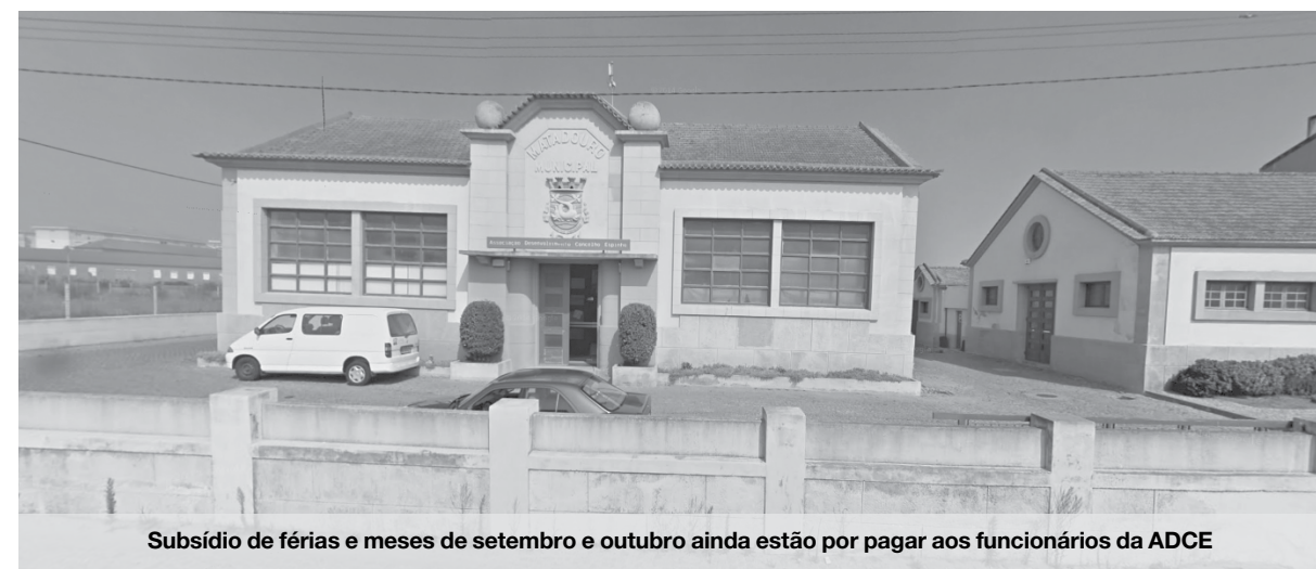
Subsídio de férias e meses de setembro e outubro ainda estão por pagar aos funcionários da ADCE

Neste momento, ao que o Maré Viva conseguiu apurar, os funcionários da ADCE têm ainda por receber os salários de setembro e de outubro. Segundo o que foi possível ainda apurar, os ordenados em atraso estão a causar muitos transtornos aos trabalhadores que, como todos, têm contas para pagar. São vários os casos de famílias que, com filhos na escola e casas