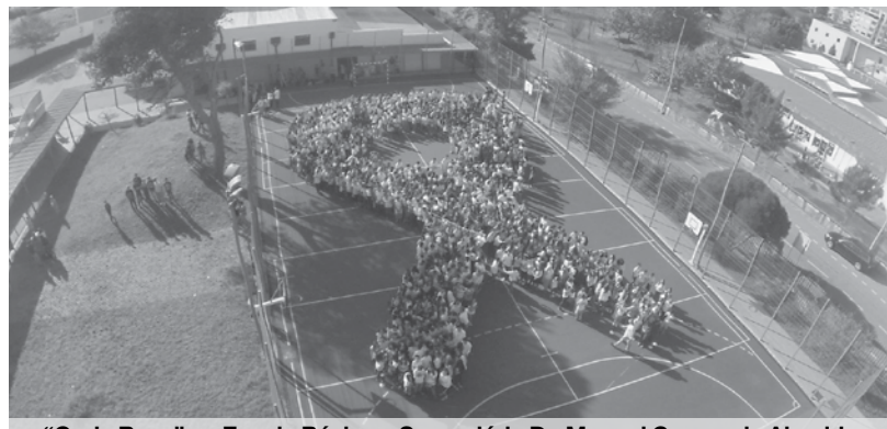
“Onda Rosa” na Escola Básica e Secundária Dr. Manuel Gomes de Almeida

Uma enorme “Onda Rosa” alastrou por todas as Escolas do Agrupamento no passado dia 30 de outubro, pela manhã (na hora do intervalo). A iniciativa solidária visou assinalar o Dia Nacional da Luta Contra o Cancro da Mama e todos os alunos, professores e pessoal do Agrupamento Escola Sede (Dr. Manuel Gomes de Almeida, Escola Básica Domingos Capela, Escola Básica n.º 2 de