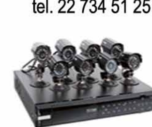
VIGILÂNCIA E SEGURANÇA