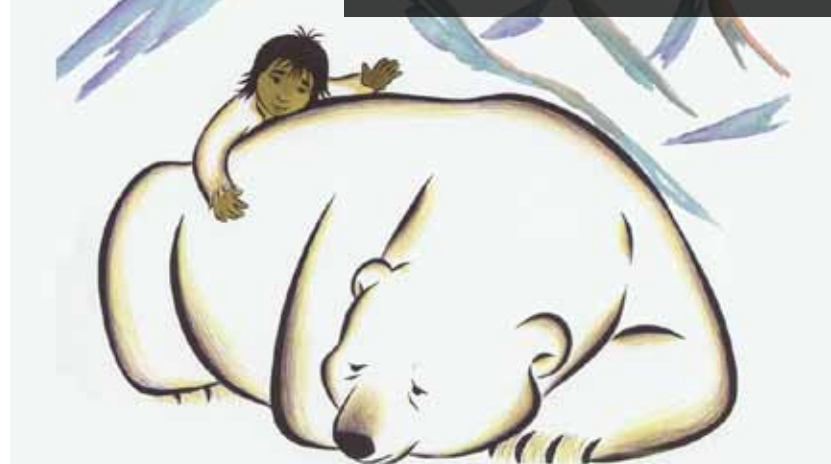
"O menino que queria ser urso" de Jannik Hastrup, Dinamarca

Centro Multimeios de Espinho Sala António Gaio | Entrada Livre