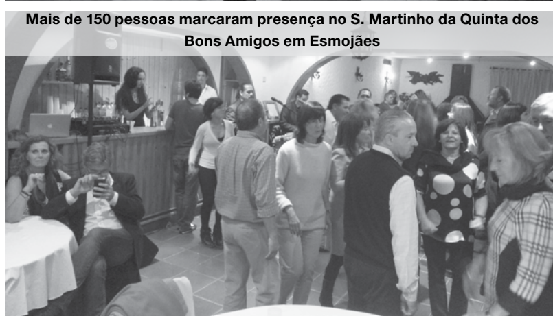
Mais de 150 pessoas marcaram presença no S. Martinho da Quinta dos Bons Amigos em Esmojães