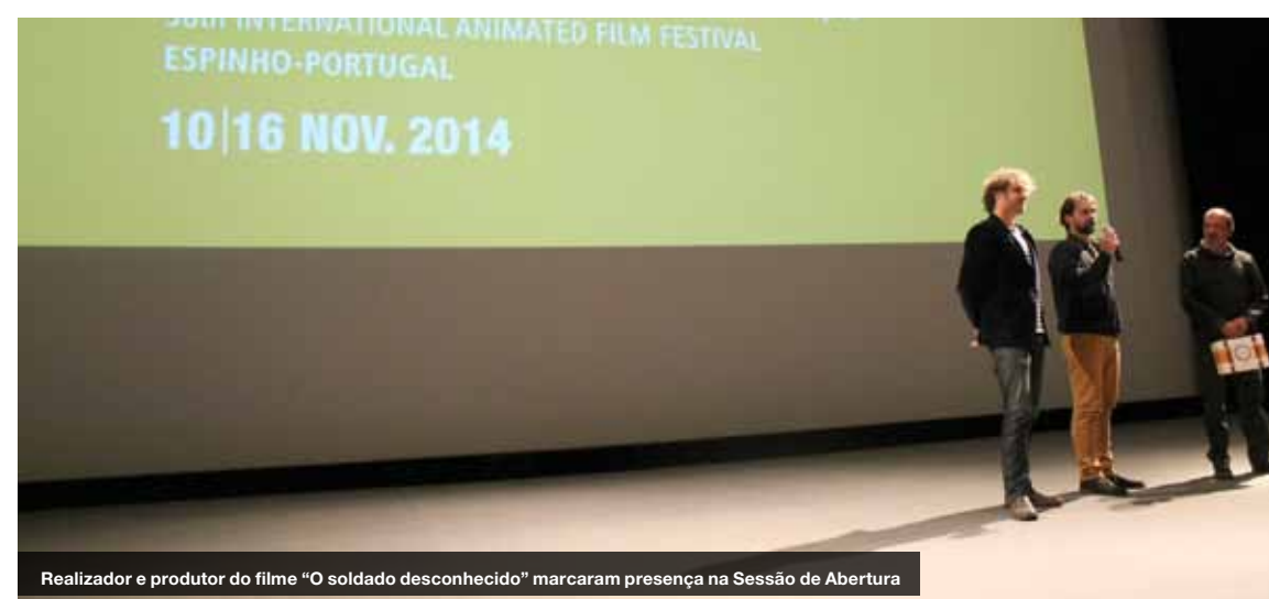
Realizador e produtor do filme "O soldado desconhecido" marcaram presença na Sessão de Abertura

A 38.ª EDIÇÃO DO CINANIMA - FESTIVAL INTERNACIONAL DE CINEMA DE ANIMAÇÃO DE ESPINHO arrancou na segunda-feira passada com 21 estreias mundiais e 46 nacionais, tendo a concurso 88 filmes selecionados após um recorde de candidaturas na história do evento.