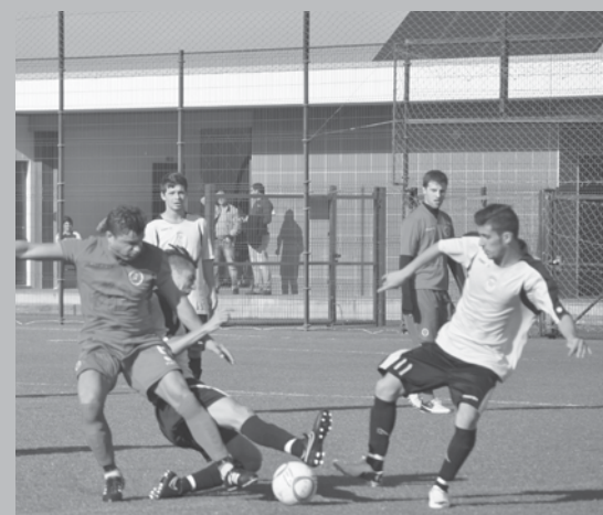
Ág. Anta venceram o Bairro P. Anta

Já na manhã deste domingo foi cumprido em sua memória um minuto de silêncio nos jogos da Taça e o mesmo triste motivo levou ao adiamento do jogo entre a Juventude Outeiros e o Desportivo Ponte Anta. À sua família, amigos e ao clube, o Maré Viva apresenta as suas condolências. NO