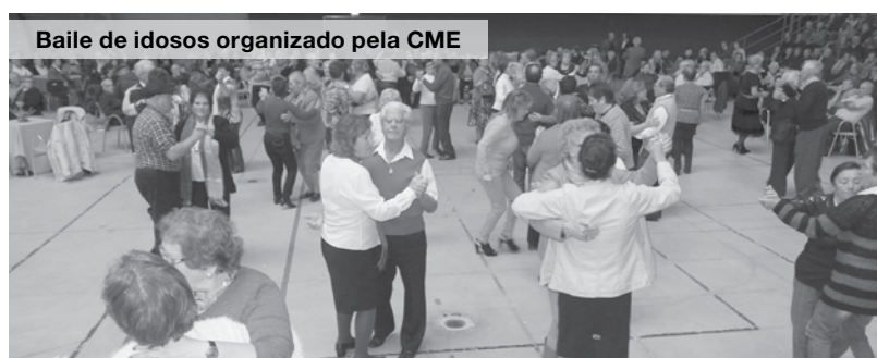
Baile de idosos organizado pela CME