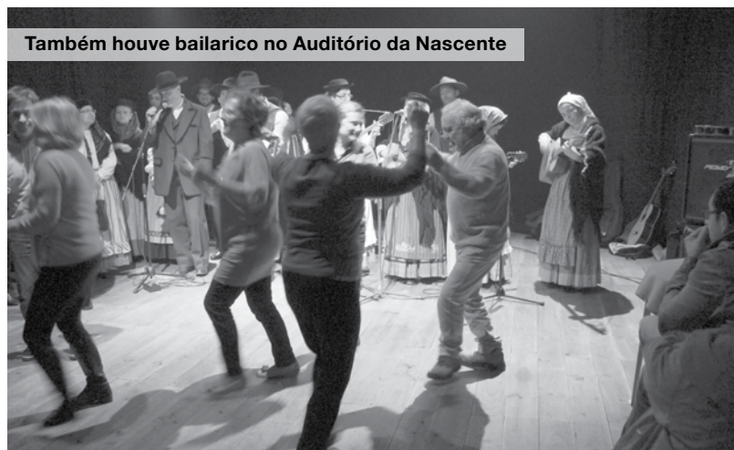
Também houve bailaico no Auditório da Nascente