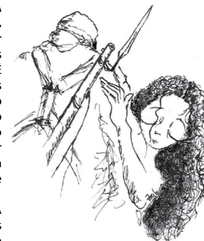
Ilustração de Paulo Barrosa

13 Nov. | 22:00 | Especial Cinema de Animação sobre a Grande Guerra 14 - 18 14 Nov. | 22:00 | O soldado desconhecido | Jérémie Malavoy | França