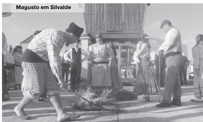
Magusto em Silvalde