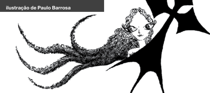
Ilustração de Paulo Barrosa

14 Nov. | 22:00 | Especial Cinema de Animação da Bretanha