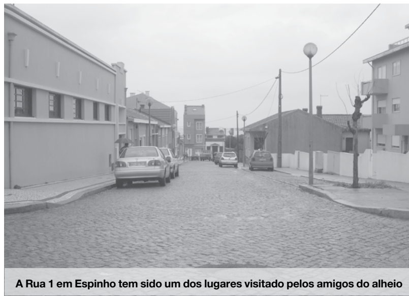
A Rua 1 em Espinho tem sido um dos lugares visitado pelos amigos do alheio

A dificuldade não é muita e a estratégia também não é elaborada. Pouco depois das 5 horas da madrugada, um grupo de assaltantes escolhe viaturas estacionadas sem alarme, partem o vidro traseiro mais pequeno, abrem o carro e tiram o que lhes apetece. Óculos de sol, comandos de garagens, carregadores de telemóveis, portachaves, porta-moedas...são alguns exemplos de materiais já furtados pelos larápios. Curiosamente, e ao contrário do que é esperado nestas ações, os as-