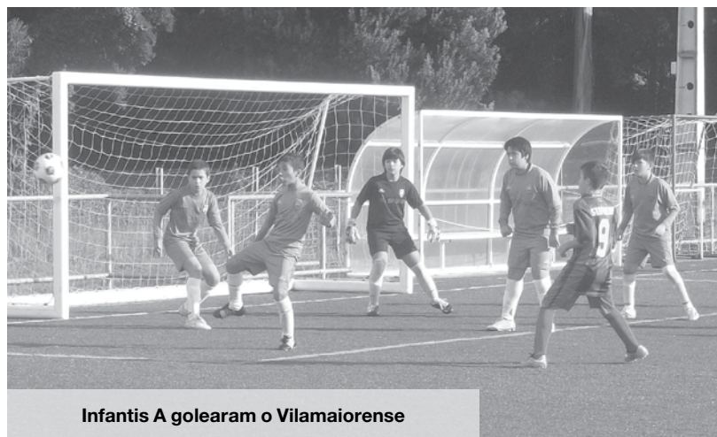
Infantis A golearam o Vilamaiorense

A equipa de Iniciados B do Anta venceu por três golos sem resposta a equipa do Lusitânia de Lourosa. Numa entrada algo morna em jogo, os Antenses foram aos poucos assumindo-se como candidatos à vitória no jogo. Com vários livres e cantos a seu favor, os de Anta iam tendo vários lances de golo mas nenhum deles foi concretizado com sucesso. A equipa forasteira tentava de forma simples chegar à baliza dos Antenses mas durante o jogo todo, não tiveram uma única oportunidade de golo. Assim e num lance confuso, os Antenses chegaram ao primeiro golo que funcionou com desbloqueador. Após o golo os de Anta continuaram a carregar mas as tomadas de decisões nem sempre eram as melhores. Mesmo assim e num remate à entrada da área, os de Anta fizeram o segundo golo. Para a segunda parte pediam-se mais qualidade à equipa de Anta, mas o jogo desenrolou-se na mesma toada da primeira. Muita bola para os Antenses, mas ao mesmo tempo muitas más decisões. Os lances de perigo foram poucos, até que já em tempo de desconto os Antenses chegaram ao terceiro golo através da marcação de um livre indireto dentro da pequena