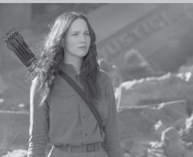
THE HUNGER GAMES: A REVOLTA – PARTE 1