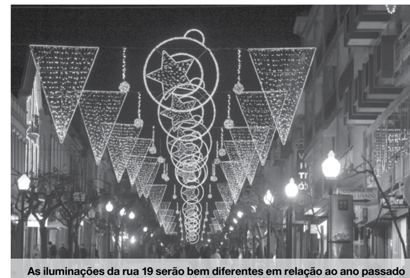
As iluminações da rua 19 serão bem diferentes em relação ao ano passado

Nos dias 13, 14, 20 e 21 de dezembro será criado um espaço de animação na rua 19 onde as crianças terão a oportunidade de escrever uma carta ao velhinho de barbas. Em "Roulotte la Belle" os