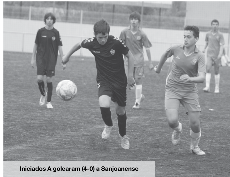
Iniciados A golearam (4-0) a Sanjoanense