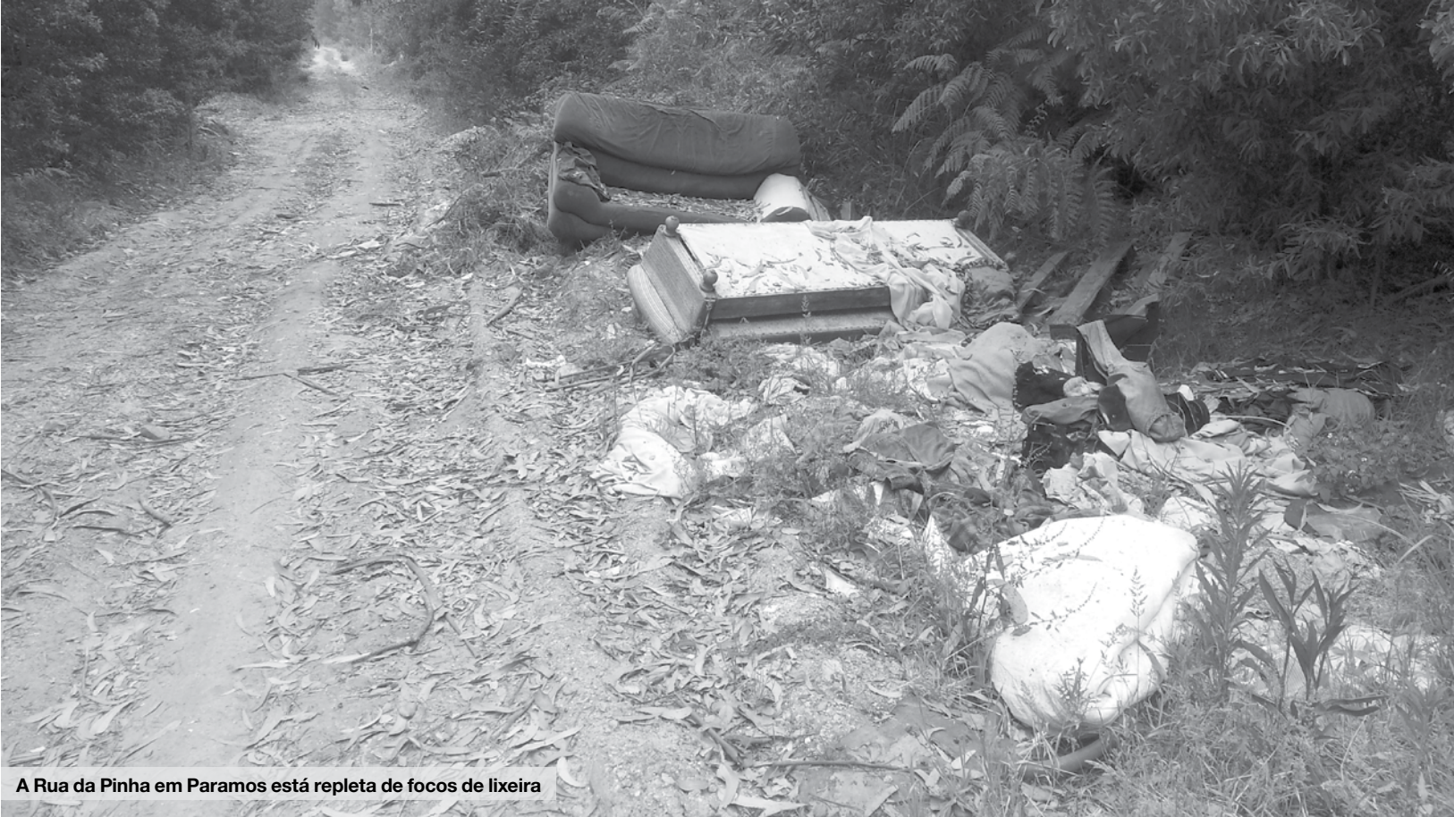
A Rua da Pinha em Paramos está repleta de focos de lixeira