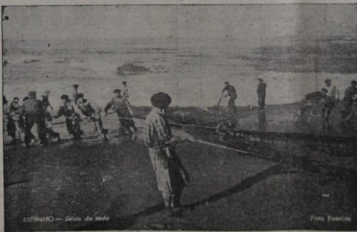
Por esta imagem, pode ver-se na zona piscatória de Espinho, os preparativos para a faina da pesca de arrasto