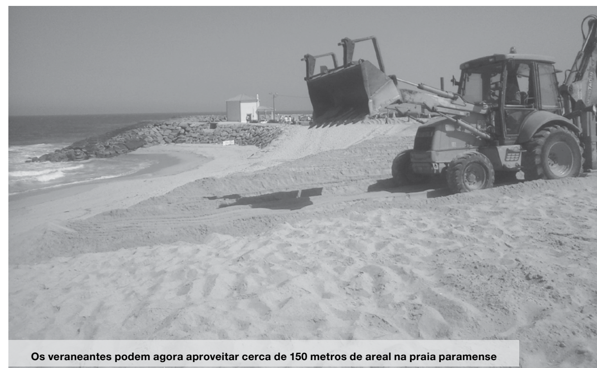
Os veraneantes podem agora aproveitar cerca de 150 metros de areal na praia paramense

Nos últimos dias e depois do empreiteiro ter retirado a rede de vedação da empreitada para uma zona mais a sul, a Junta de Freguesia esteve a ultimar os preparativos necessários para