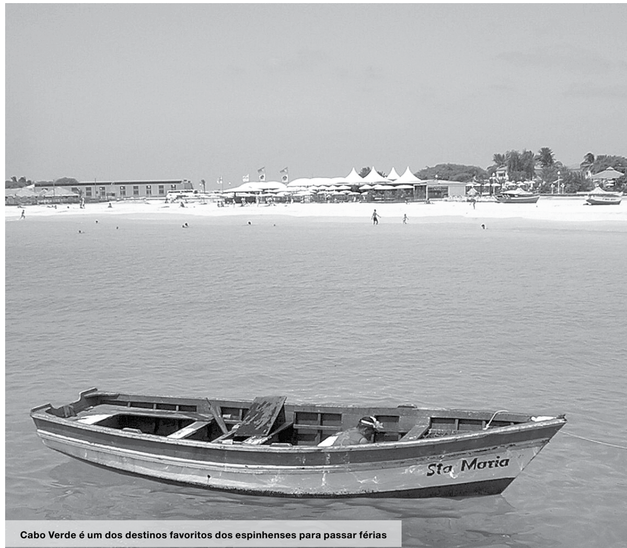
Cabo Verde é um dos destinos favoritos dos espinhenses para passar férias