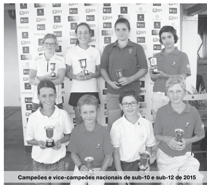
Campeões e vice-campeões nacionais de sub-10 e sub-12 de 2015

E apesar de só este ano se ter transferido para o Oporto Golf