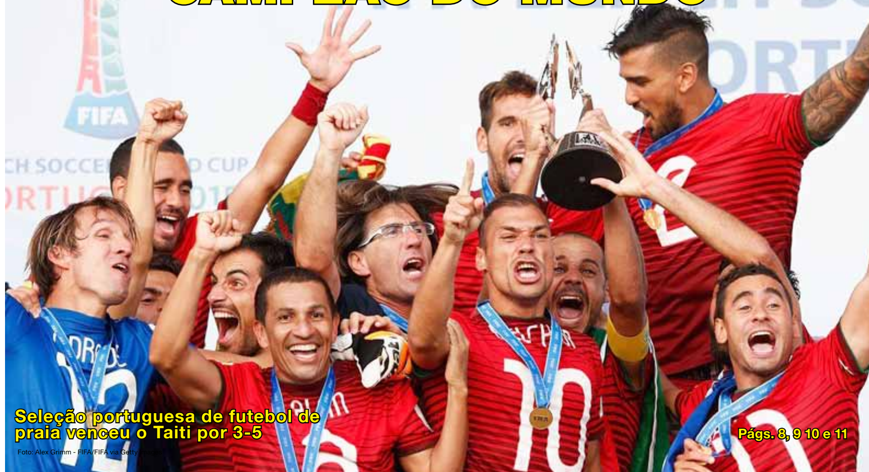
Seleção portuguesa de futebol de praia venceu o Taiti por 3-5