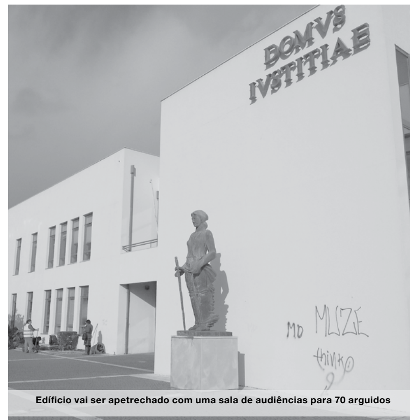
Edifício vai ser apetrechado com uma sala de audiências para 70 arguidos

O autarca defendeu desde o início da Reforma Judicial a manutenção das valências do Tribunal de Espinho, alegando a funcionalidade, localização e acessibilidade do edifício para servir os vários intervenientes em processos de Justiça. NO