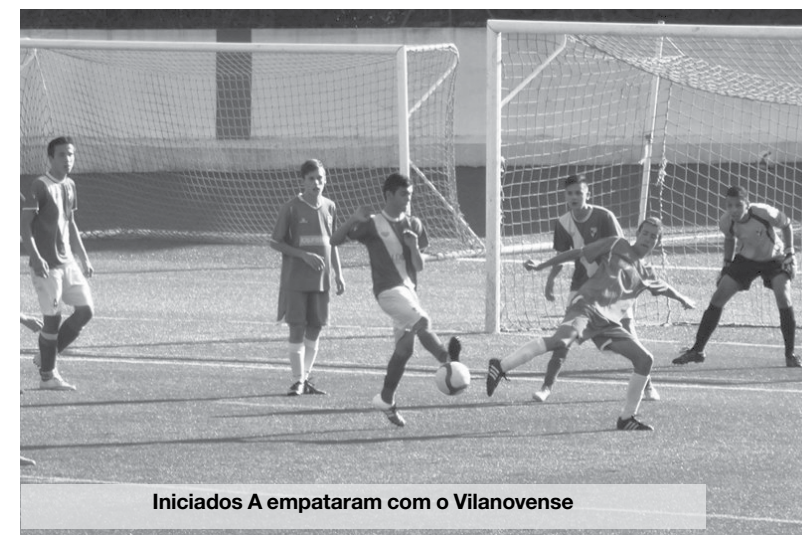
Iniciados A empataram com o Vilanovense

A equipa de Benjamins da ADF Anta teve este fim de semana um primeiro teste após uma semana apenas de trabalho e saiu vergada de Oliveira de