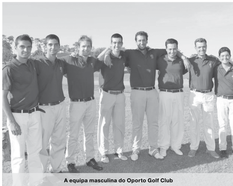
A equipa masculina do Oporto Golf Club

No Morgado do Reguengo Golf Belas e de 2014 em Espinho