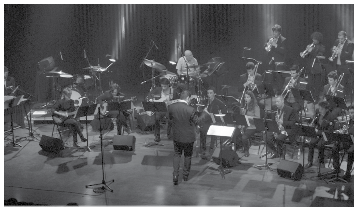
Sexta-feira há concerto da Orquestra de Jazz no Auditório de Espinho

sim! Estamos a preparar um bom “panelão” de música para que todos saiam daqui de barriga cheia!