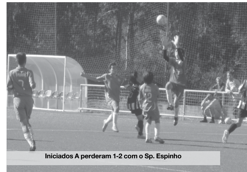
Iniciados A perderam 1-2 com o Sp. Espinho

Mais um jogo de treino de início época contra a equipa do Serzedo. Este encontro resume-se em duas partes bastantes distintas. Na primeira parte, a equipa antense esteve muito abaixo que era esperado, sem dedicação, empenho, falta de concentração, pouca circulação de bola, bastantes dificuldades nas transições defesa ataque e por isso o resultado de 5-0 ao intervalo não foi de estranhar. Na segunda parte, os Baixinhos melhoraram um pouco e ainda reduziram o marcador, mas