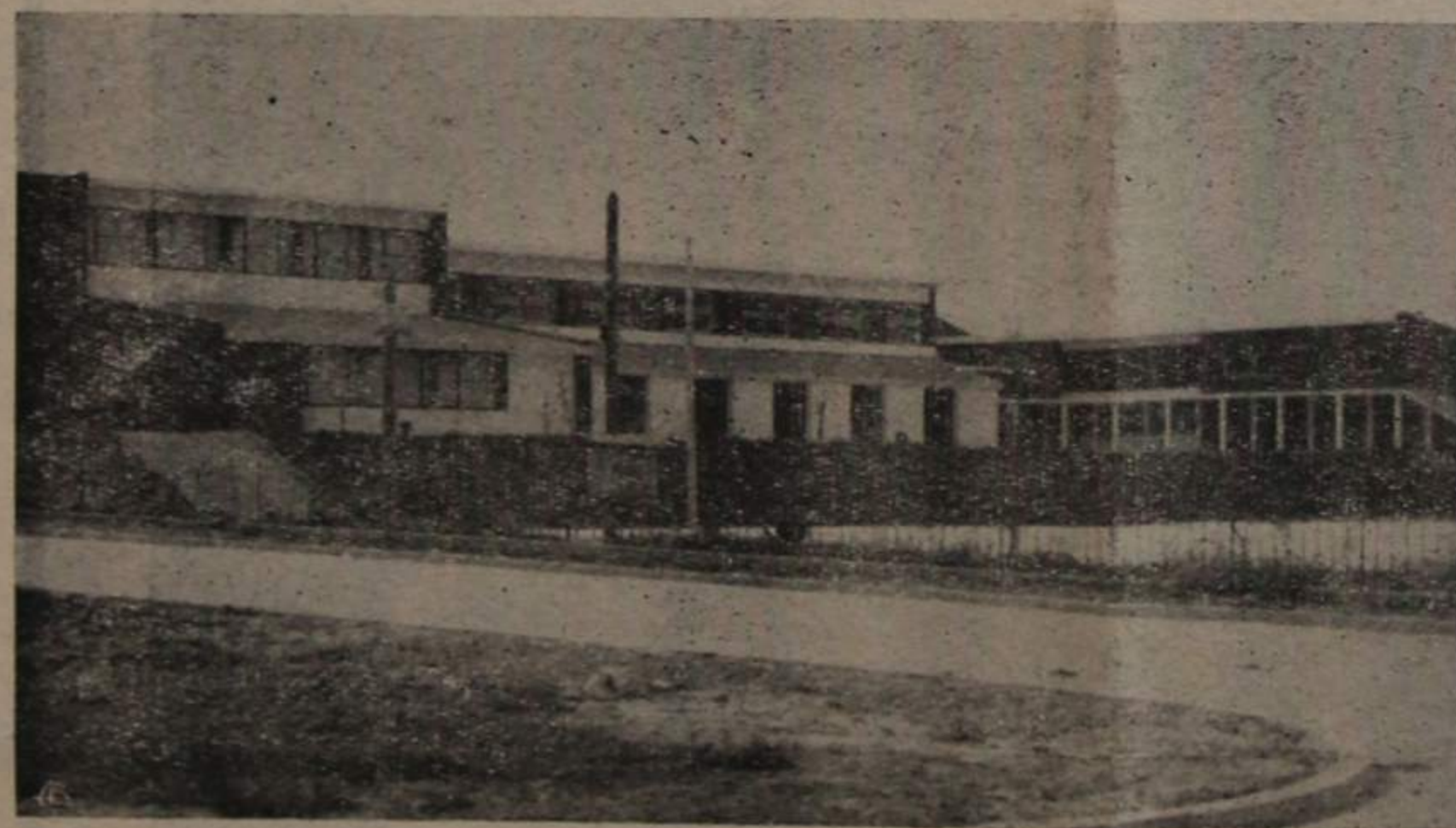
Vista parcial de um dos ângulos do lado do norte