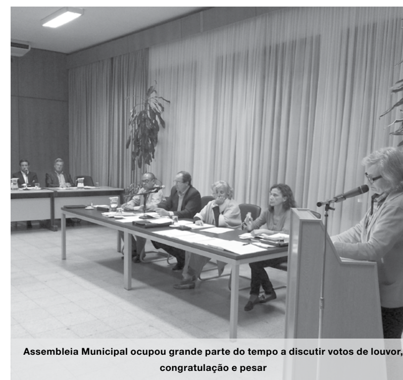
Assembleia Municipal ocupou grande parte do tempo a discutir votos de louvor, congratulação e pesar

PS e PSD apresentaram votos de pesar pelo falecimento de An-