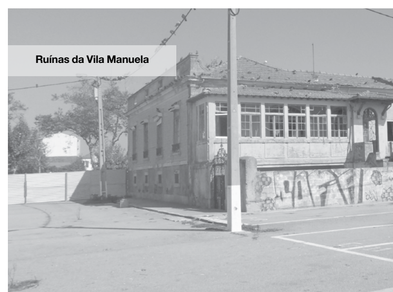
Ruínas da Vila Manuela

Mas também poderá acontecer que o local esteja destinado a um parque de estacionamento subterrâneo. No contrato de 2005, seria construído este parque e outro no quarteirão frente à Igreja Matriz como contrapartida pela conces-