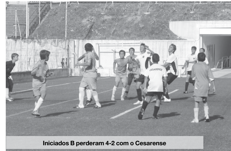
Iniciados B perderam 4-2 com o Cesarense

ses impuseram-se categoricamente com uma goleada. Frente a uma das equipas que vão encontrar no campeonato, os Baixinhos foram donos e senhores do jogo e ao resultado juntaram momentos de grande inspiração individual e colectiva.