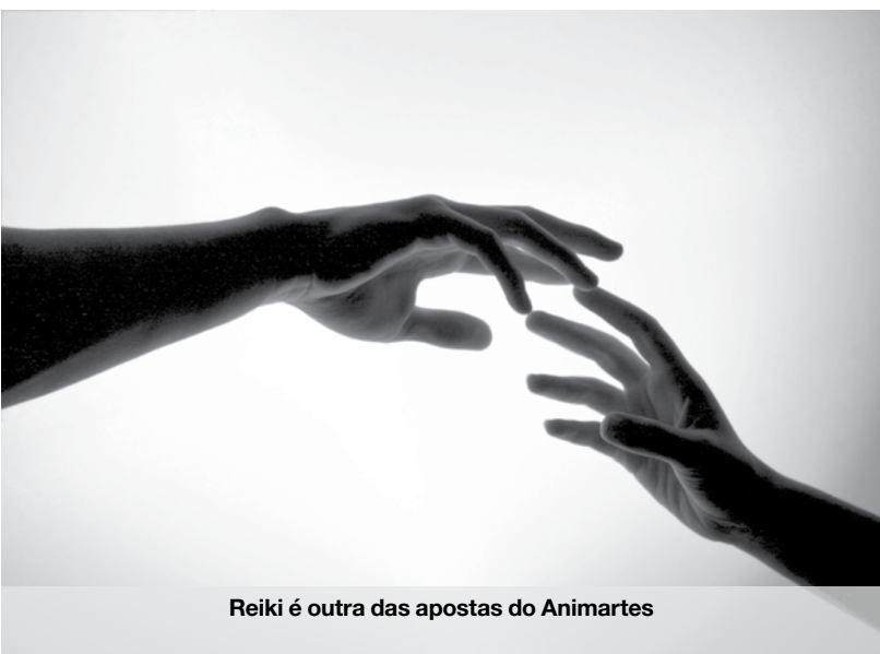
Reiki é outra das apostas do Animartes

É no próximo sábado, às 17:00, no Auditório Nascente (Rua 16, 1200), com entrada livre. Os pedidos de informação e inscrição em qualquer modalidade Animartes devem ser efetuados para os telefones 227331357 e 918134655, email comunicacao@nascente.org.pt ou na sede da Nascente – R. 62, 251, em Espinho. MV