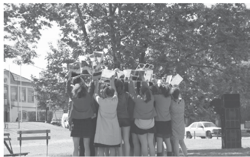
Espectáculo “Quantos são EU?” será dia 31 de outubro no Auditório Nascente

A segunda proposta, mais na área da performance teatral, está marcada para o dia 31, no Auditório Nascente, onde se vai apresentar o trabalho “Quantos são EU?”, da responsabilidade da Casa dos Choupos, de Santa Maria da Feira, e do seu projeto “Poesia no Corpo. Corpo na Poesia”. Com este trabalho, “o grupo