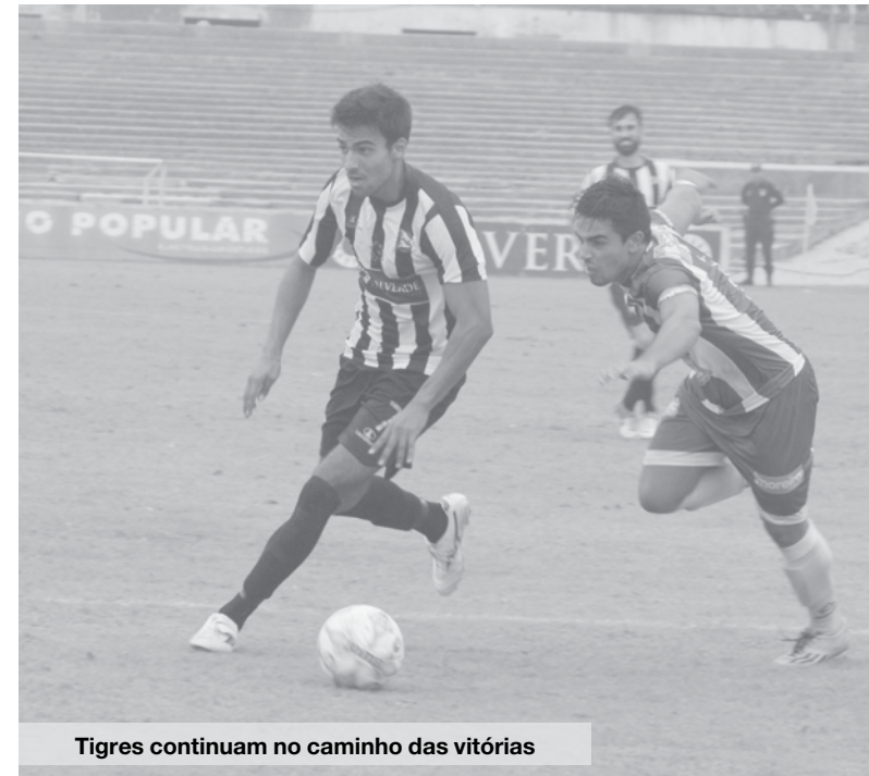
Tigres continuam no caminho das vitórias

Os espinhenses arregaçaram as mangas e partiram à conquista de mais três preciosos pontos. Até ao intervalo, o Sp. Espinho