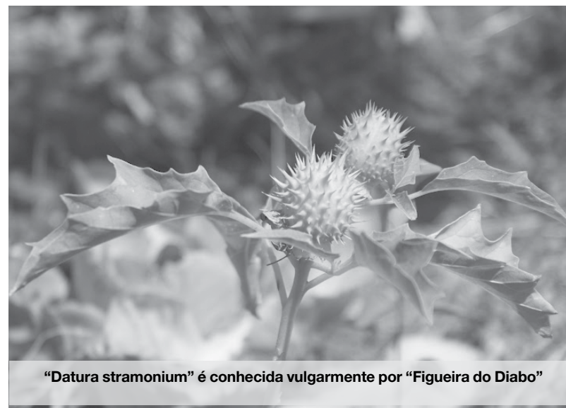
“Datura stramonium” é conhecida vulgarmente por “Figueira do Diabo”

A planta estava na zona exterior da horta comunitária do Bairro da Quinta em Paramos. Após