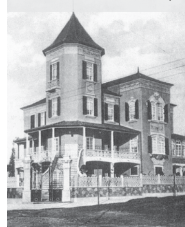
Palacete Rosa Pena noutros tempos