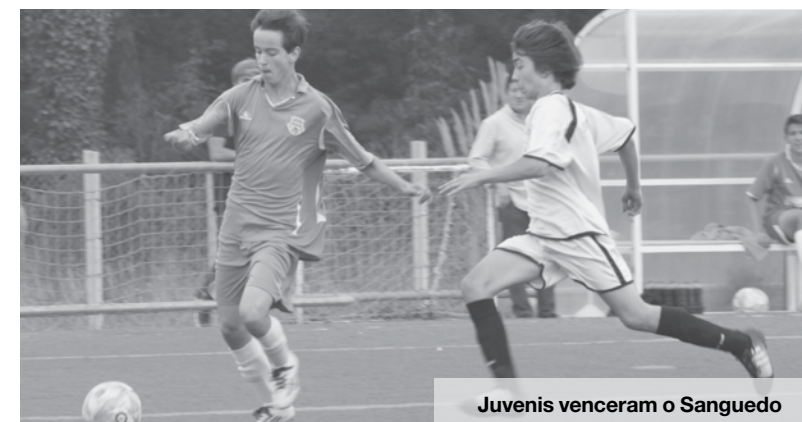
Juvenis venceram o Sanguedo

Iniciados A – Campeonato da 1.ª divisão da AF Aveiro - C Cesarense 5 - 1 Baixinhos