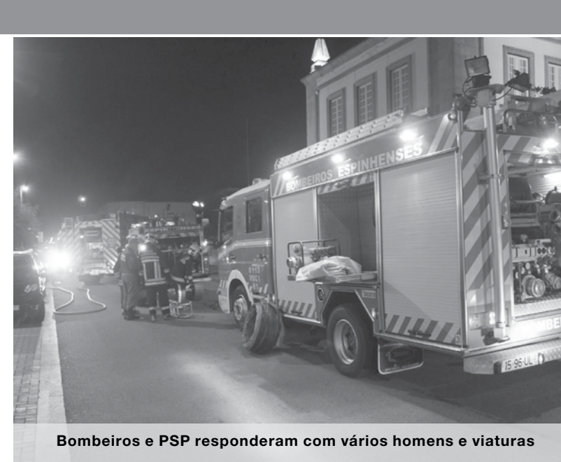
Bombeiros e PSP responderam com vários homens e viaturas