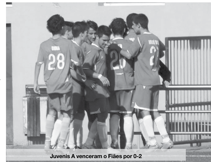
Juvenis A venceram o Fiães por 0-2