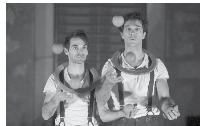
Erva Daninha com atuação marcada para dia 27 no Auditório de Espinho

Ainda antes de 2016, o Auditório de Espinho será palco de quatro novos espetáculos. A Orquestra Clássica de Espinho, a Companhia Erva Daninha e a Orquestra de Jazz da Escola Profissional de Música de Espinho (EPME) dividem o protagonismo da programação de novembro e dezembro.