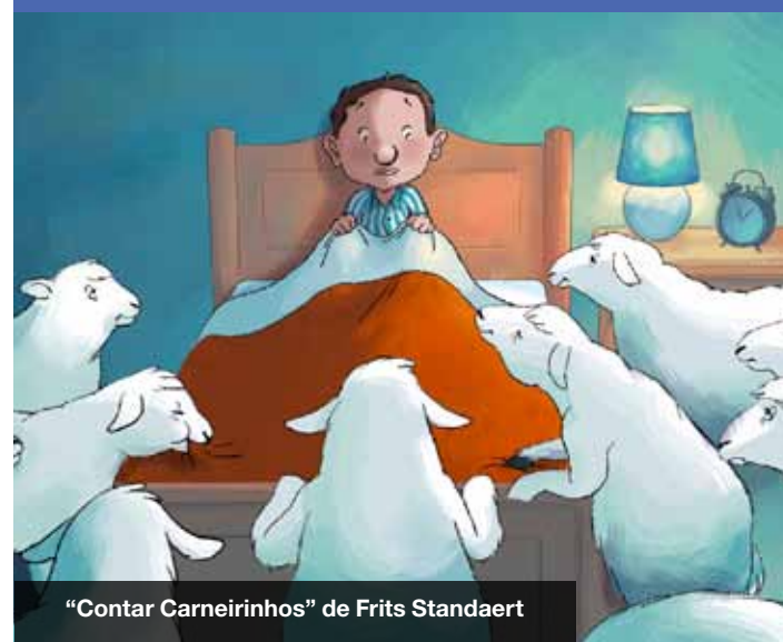
“Contar Carneirinhos” de Frits Standaert

SERIEIA ANIMADA “Saudades” de Shiroi Unabara, Japão