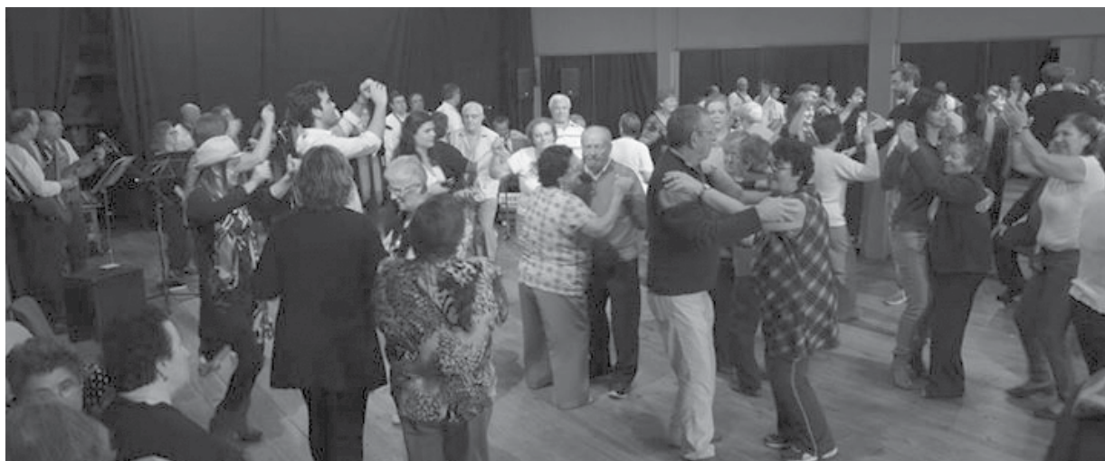
Cerca de 100 idosos marcaram presença em mais um evento organizado pela Cooperativa Nascente

O pretexto foi uma festa no dia de São Martinho e não podia ter havido melhor escolha. A última iniciativa deste ano do Projeto ComViver, dirigido aos idosos dos Lares e Centros de Dia do concelho de Espinho, teve música, castanhas e muita animação, a lembrar que para o ano tem de haver mais.