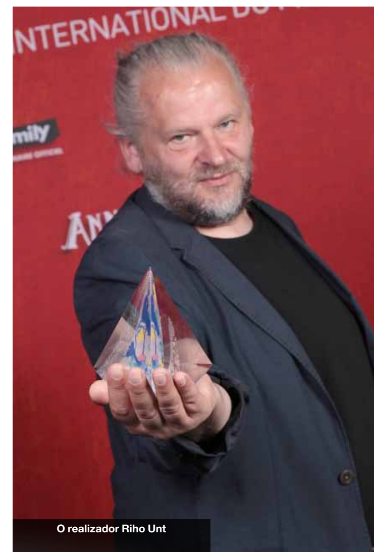
O realizador Riho Unt

O filme foi feito no estilo mais clássico de marioneta, utilizando a técnica stop motion . Quando o estava a criar, o objetivo era utilizar o menor número possível de efeitos feitos em computador. As marionetas tiveram um esqueleto de metal coberto com várias camadas de tecido. Escolhi fazer o “The Master” desta maneira porque tenho trinta anos de experiência nesta técnica e não sou muito fã do 3D.