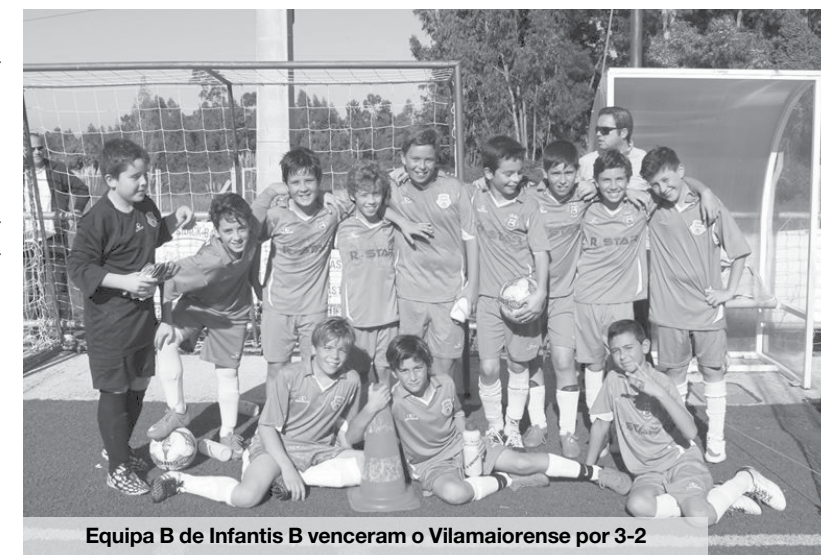
Equipa B de Infantis B venceram o Vilamaiorense por 3-2