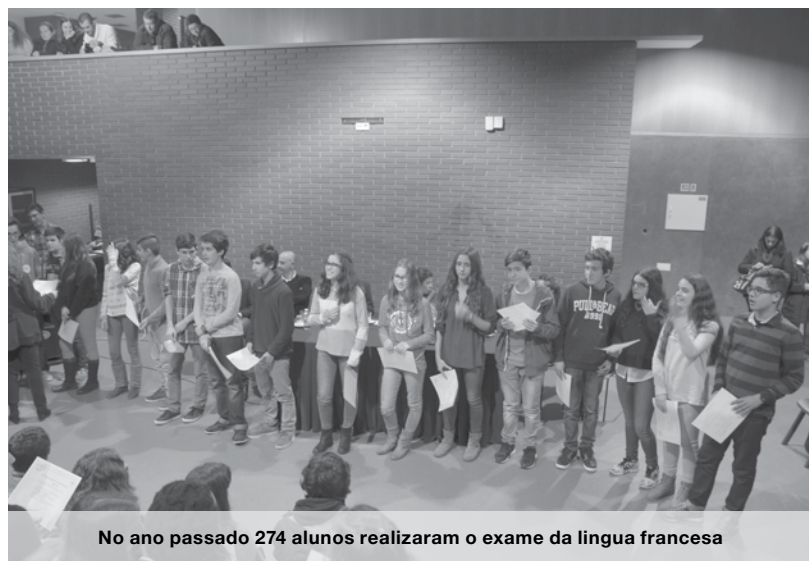
No ano passado 274 alunos realizaram o exame da língua francesa

DELFF é a sigla para Diploma de Estudos de Língua Francesa. Trata-se de um documento oficial, emitido pelo Ministério Francês da Educação Nacional, para certificar as competências de