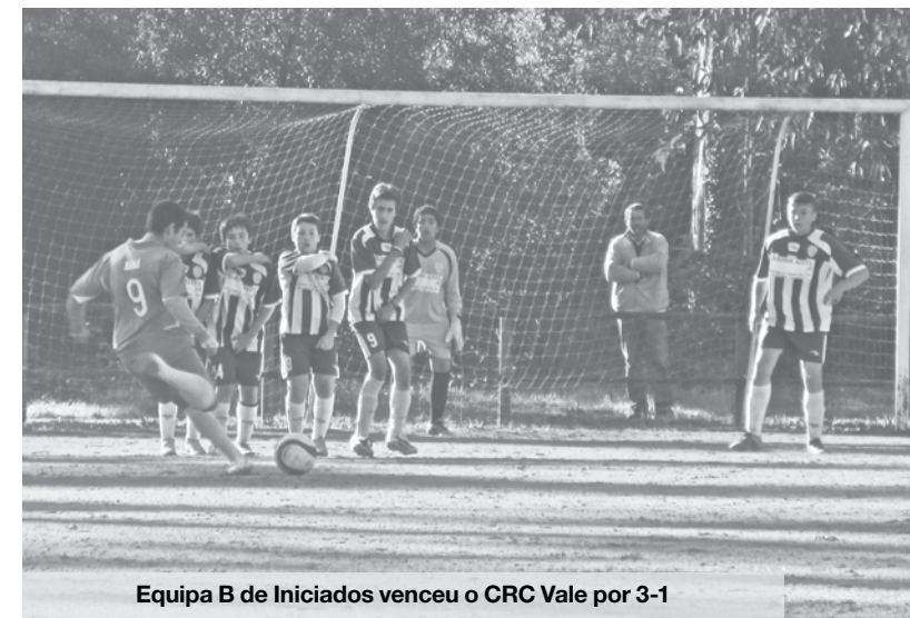
Equipa B de Iniciados venceu o CRC Vale por 3-1

Traquinas B – Equipa B – Torneio Pré-Competitivo – série B