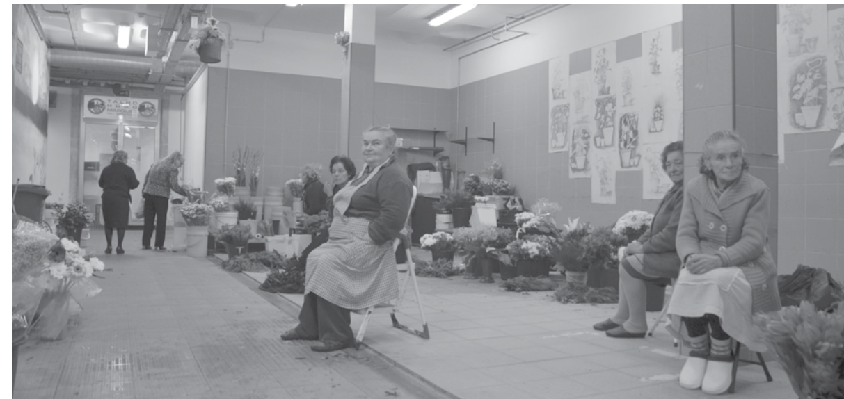
Longe vão os tempos em que os comerciantes do Mercado não tinham mãos a medir para atenderem tantos clientes

O comerciante acredita que a vinda da Segurança Social e do IEFP