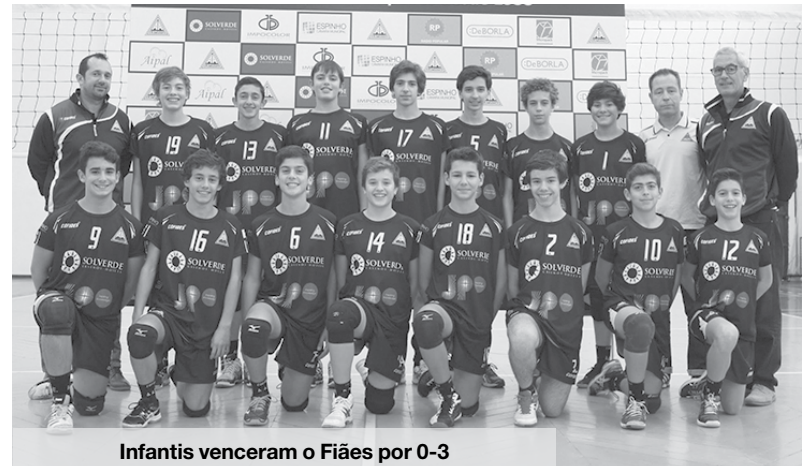
Infantis venceram o Fiães por 0-3