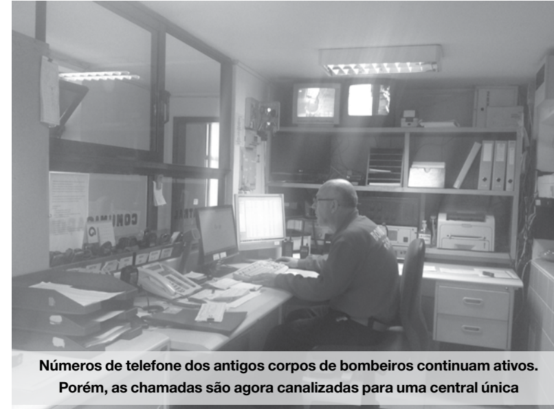
Números de telefone dos antigos corpos de bombeiros continuam ativos. Porém, as chamadas são agora canalizadas para uma central única

Apesar de os meios estarem distribuídos em duas companhias, nos antigos quartéis dos Bombeiros de Espinho e Espinhenses, a central recebe todas as chamadas num único local, o que permite uma maior rentabili-