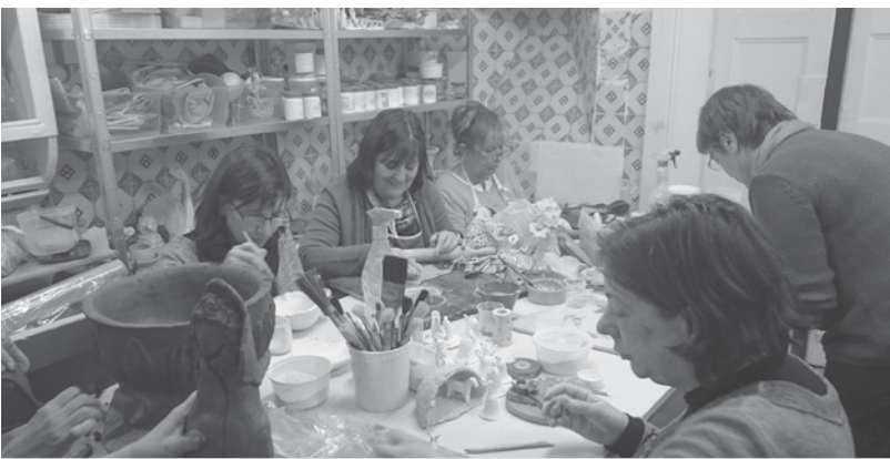
Ateliê de Cerâmica tem vindo a realizar peças para vender na banca de Natal

Ainda para os mais pequenos, está prevista uma festa promovida pelo grupo de Hip Hop Royal Crew, integrado no Animartes, no dia 20 à tarde, e logo no dia