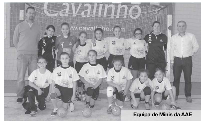
Equipa de Minis da AAE