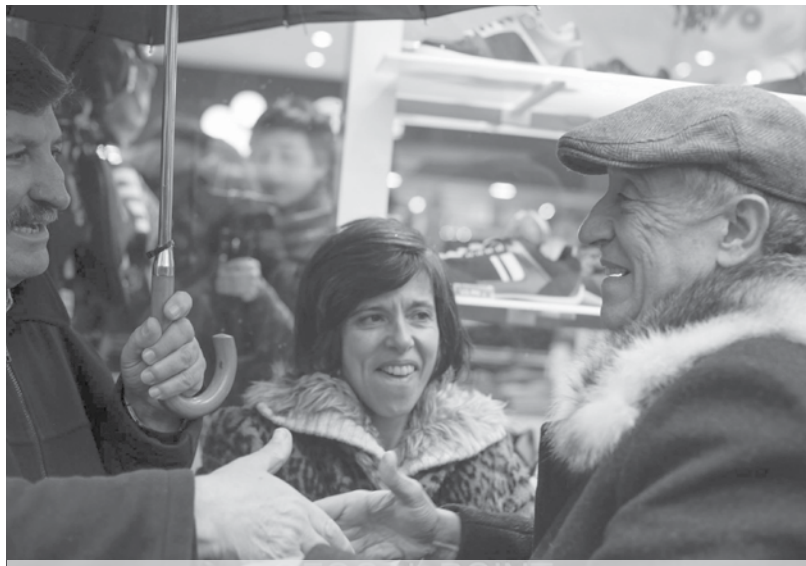
Nem a chuva afastou Marcelo de cumprimentar os espinhenses

Depois da breve conversa com o deputado espinhense e líder parlamentar do PSD, Marcelo foi verdadeiramente engolido pelos apoiantes que o aguardavam na Rua 19. Igual si próprio, o “professor” respondeu com bom humor às inúmeras solicitações que lhe foram fazendo, entre abraços, beijos, fotografias de telemóvel e incentivos à “campanha limpa” que protagoniza. “É como eu sou”, ripostou o candidato pre-