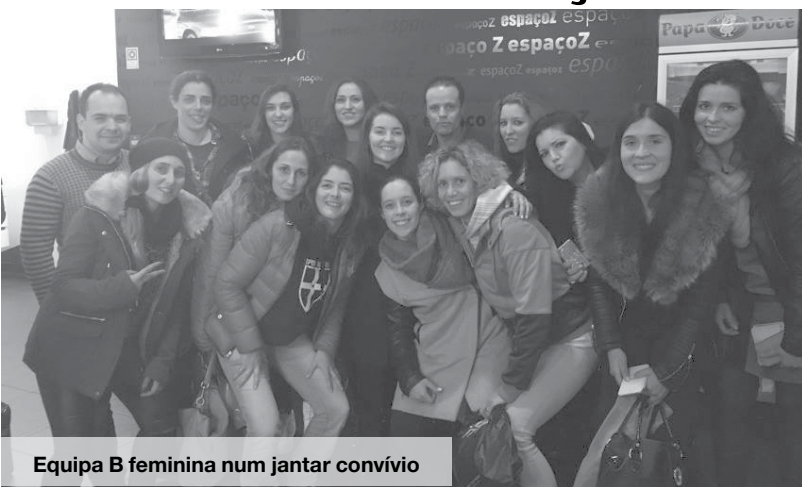
Equipa B feminina num jantar convívio

No domingo passado, as Séniores Femininas B da Novasemente receberam a formação do "Always Young" e empataram a uma bola, um resultado muito injusto para as antenses.