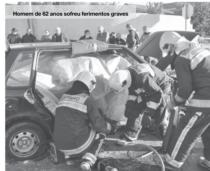
Homem de 62 anos sofreu ferimentos graves

O condutor da outra viatura envolvida, um homem de 70 anos, não sofreu qualquer ferimento.