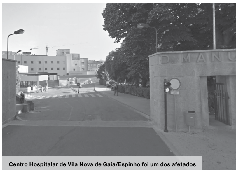
Centro Hospitalar de Vila Nova de Gaia/Espinho foi um dos afetados

Segundo o responsável, na área da saúde há vários blocos operatórios encerrados (hospitais São João e Santo António no Porto, Centro Hospitalar de Gaia e Hos-