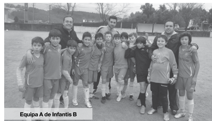
Equipa A de Infantis B

O resultado de 2-0 ao intervalo era curto tendo em conta o número de oportunidades de que o Anta dispôs. Na segunda parte, os antenses continuaram numa toada extremamente ofensiva, terminando o resultado num justo 5-0. Boa exibição para terminar esta fase da competição. Na próxima semana, começará a fase dos primeiros.