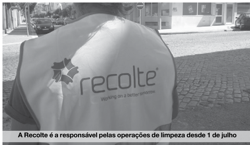
A Recolte é a responsável pelas operações de limpeza desde 1 de julho