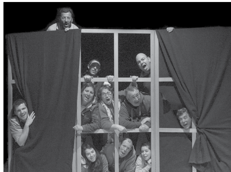
Depois da peça "Pois é!", o Teatro Popular de Espinho está de volta aos palcos

"O Grito do Mar" (Academia de Música de Espinho/GAD - Giselle Academia de Dança/TPE - Teatro