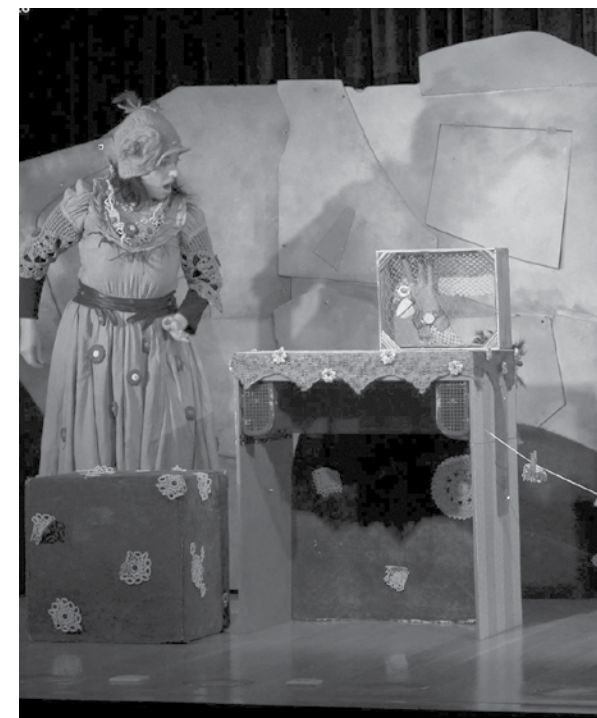
"Para que servem as mãos" da companhia Teatro e Marionetas de Mandrágora

"Clara, Cartas Bordadas", de Mai Teatro, Cia, será também apresentada no dia 13 de março, às 18h00, no Auditório de Espinho. Desenvolve a história de Clara mãe e de Clara filha, que mantém uma "correspondência peculiar". Clara mãe é costureira