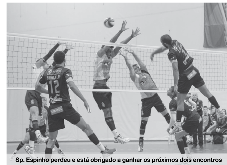
Sp. Espinho perdeu e está obrigado a ganhar os próximos dois encontros