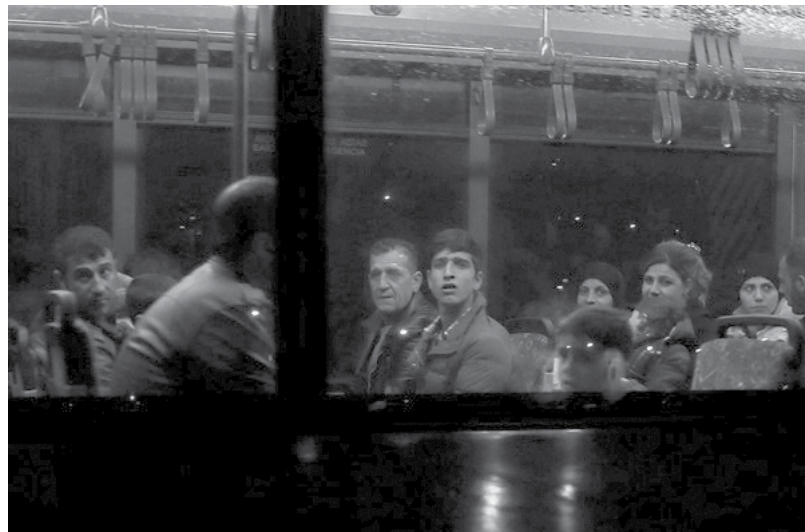
Grupo de 64 refugiados chegou a Lisboa

O governante explicou que os refugiados chegaram na madrugada desta segunda-feira ao aeroporto de Figo Maduro, em Lisboa, num voo fretado pelo Gabinete Europeu de Apoio em matéria de asilo (ASEO), no dia em que acontece o Conselho União Europeia-Turquia.