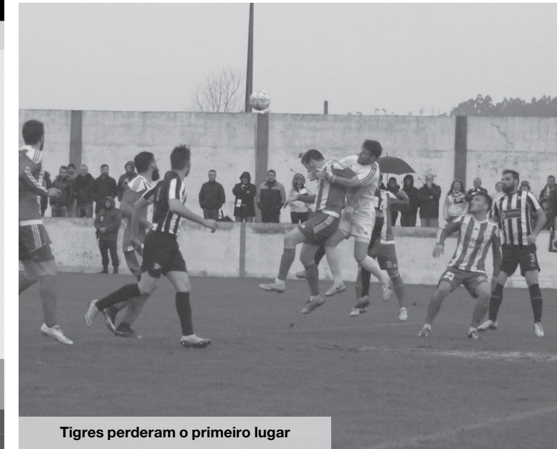
Tigres perderam o primeiro lugar