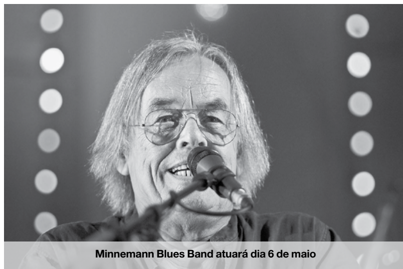
Minnemann Blues Band atuará dia 6 de maio

Tanto o jazz como os blues serão reis e senhores nas duas noites, com quatro bandas de