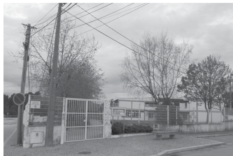
Rancho de Silvalde vai mesmo poder usar a Escola da Seara como sede

No documento, assinado a 21 de abril pelas duas partes, é possível ler que sendo a CME e JFS entidades públicas com competências e atribuições que visam prosseguir o interesse público, em que ambas concordam que o equipamento da Escola da Seara continue a prestar um serviço público, social e culturalmente relevante mas "considerando que a JFS está convicta de ser a legítima proprietária do terre-