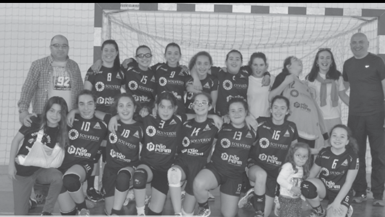
Infantis golearam o Feirense por 3-32