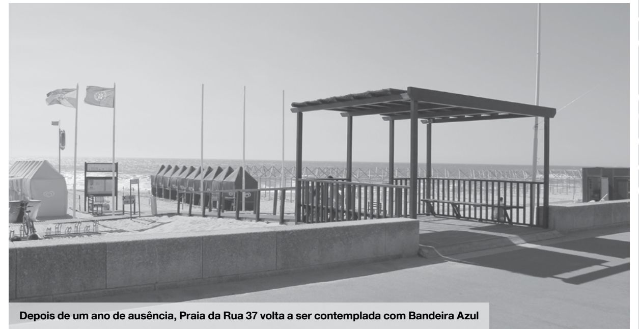
Depois de um ano de ausência, Praia da Rua 37 volta a ser contemplada com Bandeira Azul

Em termos de valores brutos, Portugal, com 314 Bandeiras Azuis, é o quinto país com mais