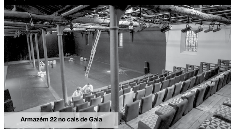
Armazém 22 no cais de Gaia

A procura destes acordos por parte da Nascente representa uma aposta na facilitação do acesso dos associados a espetáculos muito variados e por preços mais acessíveis. Para maior adesão de interessados, decorre até 21 de maio uma campanha de novos sócios, a custo mais baixo: por 15 euros até final do ano qualquer pessoa pode juntar-se a esta cooperativa cultural, poupando 5 euros e beneficiando dos descontos previstos, que incluem duas livrarias, a ABC, em Espinho, e a Unicepe, no Porto. MV