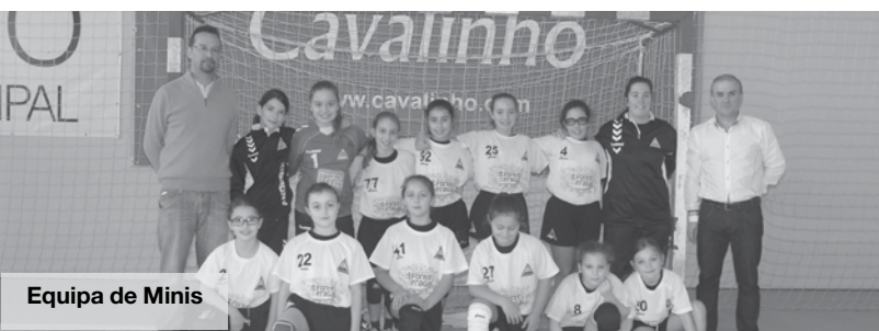
Equipa de Minis

A quem a vitória fugiu por pouco, foi à equipa de iniciadas, que na última jornada, no pavilhão Arquitecto Jerónimo Reis, não conseguiram bater a equipa vinda de Alpendorada e perderam por uma diferença de quatro golos (21.25). MV