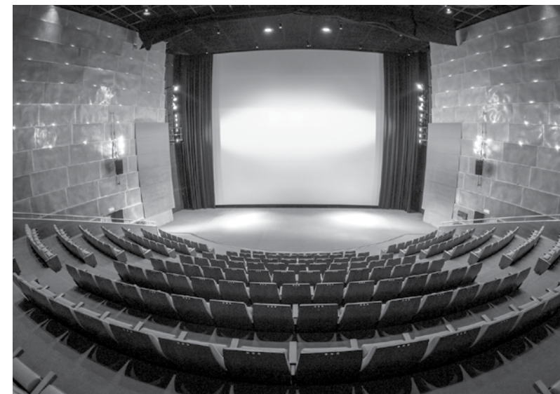
Sala António Gaio tem uma capacidade para 281 lugares sentados

A Sala António Gaio do Centro Multimeios faz parte das cerca de 500 salas que terão sessões pelo preço simbólico de 2,50€ numa sessão normal em vez dos