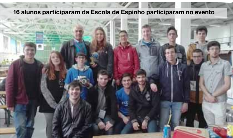
16 alunos participaram da Escola de Espinho participaram no evento

Na liga "CoSpace" , as equipas têm de desenvolver e programar estratégias adequadas para que os robôs autónomos reais e virtuais possam navegar através dos dois mundos e recolher objetos de forma cooperativa, enquanto competem com a equipa adversária.