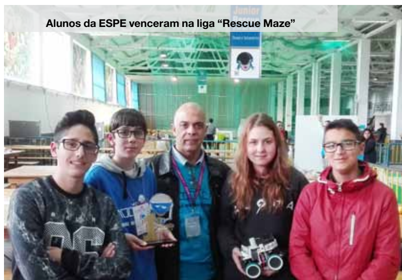
Alunos da ESPE venceram na liga "Rescue Maze"

A Escola Profissional de Espinho já esteve presente em sete Campeonatos Mundiais de Robótica: em Lisboa (2004), em Osaka, Japão (2005), em Bremen, Alemanha (2006), na Cidade do México (2012), em Eindhoven, Holanda (2013), em João Pessoa, Brasil (2014) e em Hefei, China (2015). JA