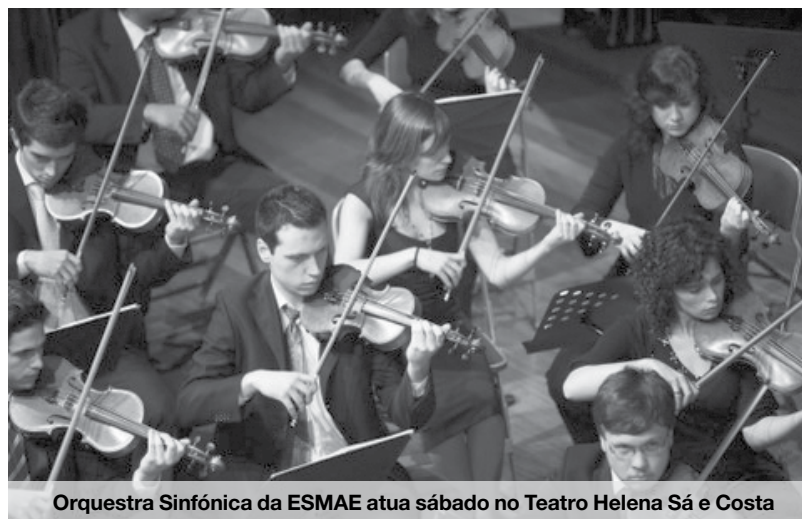
Orquestra Sinfónica da ESMAE atua sábado no Teatro Helena Sá e Costa

T eatro (a dobrar), música (idem) ou um filme de ação e aventura – esta é a dificuldade da escolha para o fim de semana que se avizinha. Se é sócio da Nascente, o seu problema vai ser escolher o ou os espetáculos que não vai querer perder e em que beneficia dos descontos que o seu cartão lhe proporciona.