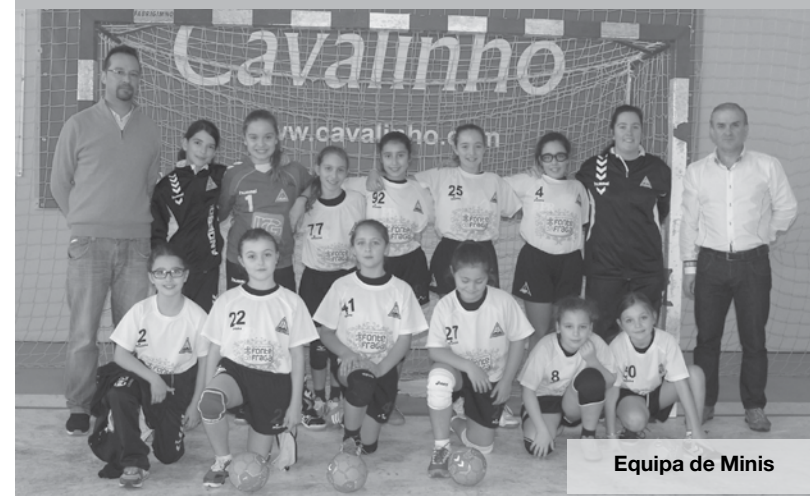
Equipa de Minis

A equipa “A” de infantis do Feirense regressou a terras da feira, com uma pesada derrota, desta feita por 37-13. Com este resultado a uma jornada do fim do Campeonato Regional, a equipa de infantis está a uma jornada de repetir a proeza do Campeonato Nacional, e terminar no 1º lugar, da Série A. MV