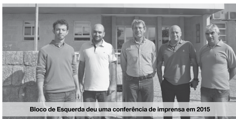
Bloco de Esquerda deu uma conferência de imprensa em 2015

Recorde-se que em Setembro de 2015, em conferência de imprensa, o Bloco de Esquerda alegou que “os enfermeiros que ali trabalham [Santa Casa da Misericórdia de Espinho] são falsos recibos verdes há vários anos; fazem mais horas do que deviam e ganham abaixo do que ganha um enfermeiro no setor público. Enquanto recibos verdes não recebem subsídio de férias nem de natal, pagam mais em impostos e não têm direito a férias”.