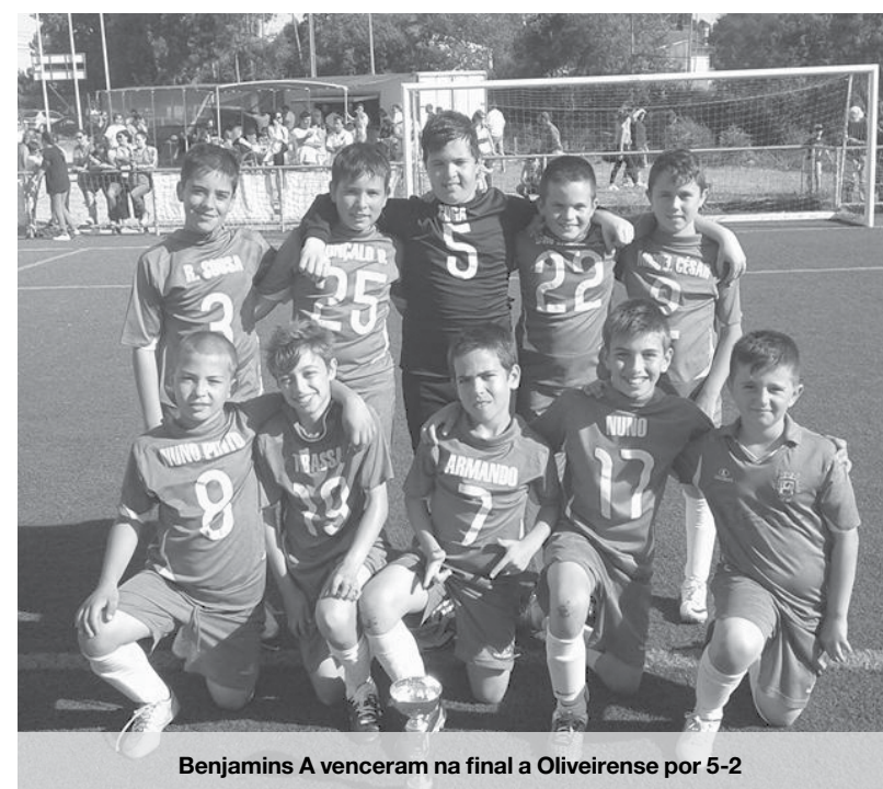
Benjamins A venceram na final a Oliveirense por 5-2

A equipa B dos Infantis B realizaram o primeiro jogo contra o Feirense, num jogo onde a equipa visitante demonstrou ter uma qualidade de jogo superior, vencendo por 5-1. A falta de criatividade e a baixa intensidade de jogo demonstrada no primeiro encontro foi colmatada para o segundo jogo. Os de Anta entraram muito fortes no jogo e conseguiram dominar o adversário durante os 40 minutos, conseguindo um resultado favorável no final do jogo em 3-1.